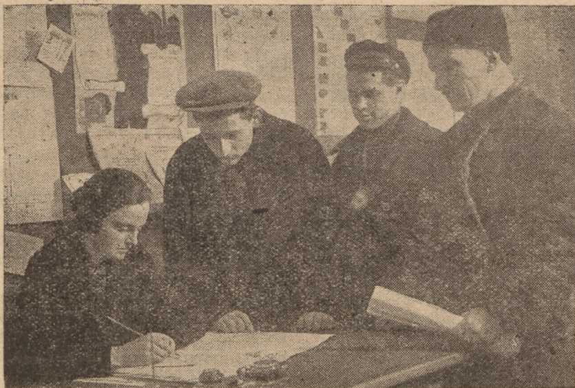
Leningradi nõukogu uute liikmete registreerimine ©moInõis