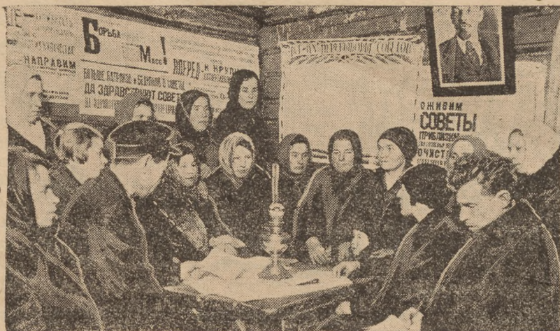
Rülandukogude walimisteeelne naistekoosolek Slobodka Moškwa kub.