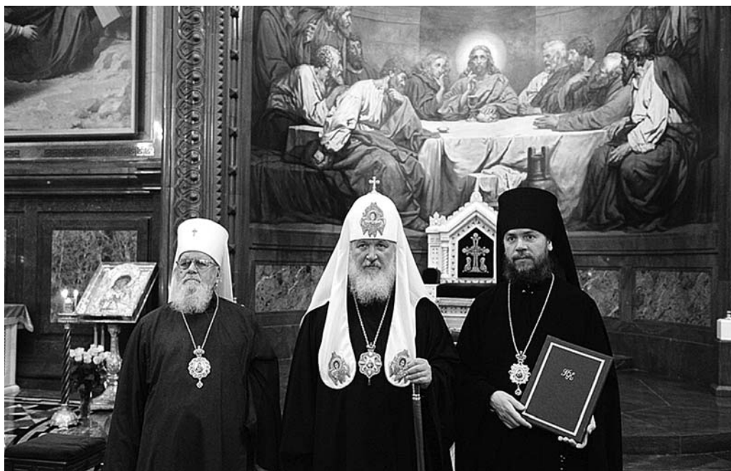
После хиротонии (слева направо: Митрополит Корнилий, Патриарх Кирилл, Епископ Лазарь).

должны помнить, что они веками живут бок о бок с представителями иных конфессий. Столетиями мы учились благожелательности и добрососедству, и сегодня обязаны помнить уроки истории, стремясь