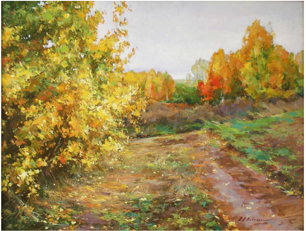
Сергей Минин «Осенняя дорога».