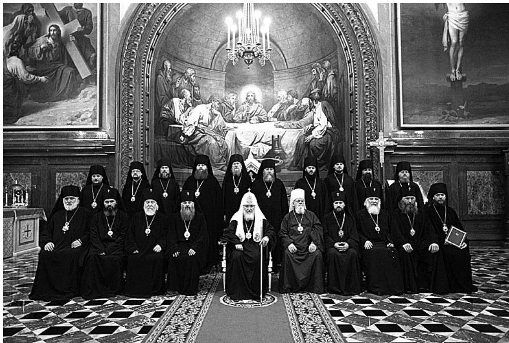
Храм Христа Спасителя. После хиротонии.

ские, но и православные всех национальностей и культур не должны чувствовать себя изгоями на Эстонской земле.