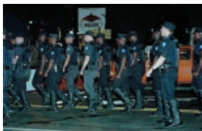
Politseinikud turvas Atlanta mängu. Salt Lake Citys on oodata turvajõudude suurenemist.

Vastab tõele, et korralduskomitee eelarve ei ole eriti paindlik, kuid see ei mõjuta mingil moel taliolümpiamängude julgeolekuprogrammide rahastamist. Föderaalvalitsus eraldas ligi 200 miljonit dollarit julgeoleku tagamiseks mängudel. Üsna tõenäoliselt lisandub sellele veel 30–40 miljonit. Utah' osariigi panus avaliku julgeoleku tagamiseks on prognooside kohaselt 35 miljonit. Ning lõpuks lisandub eeltoodule veel 35 miljonit, mis on korralduskomitee eelarves ohutuse tagamiseks määratud summa.