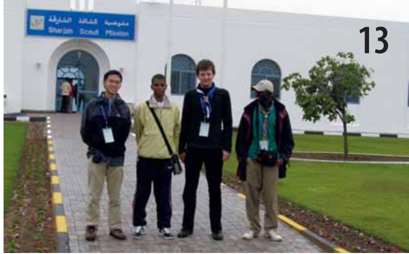
Jõudsime kohale. Tagaplaanil kohalik skaudikeskus. Vasakult: Hiina, Mauriitius, Eesti, Nigeeria.

Siis algas suur ettevalmistus pidulikuks tseremooniaks. Ehk siis et öhtupoolikuks panime oma rahvusnäitused üles ja vaibad pandi igale poole maha ning kaamerad üles, sest kokku valgus päris suur hulk rahvast ja muidugi see, kelle jaoks seda kõike tehti, Sharjahi valitseja šeik Al-Quasimmi. Temaga oli