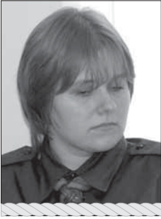
Nskm SIRJE POOL Skautlus 100/2007 koordinaator

Skautluse 100. juubeliaasta on seljataga, kuid teeme sellele tähtsale aastale ikka ja jälle tagasivaateid. Gifts for Peace oli 2007. aasta ülemaailmne skautide projekt, mille kaudu püüti pöörata tähelepanu erinevatele kohalikele probleemidele, olgu selleks siis mõnele vähekindlustatud pere lapsele jõuludeks mänguasja kinkimine, oma puu istutamine, looduskatastroofi üle elanud piirkonda raamatukogu rajamine või kooleraepidemia peatamine. Alljärgnevalt ongi kokkuvõtlik ülevaade mõnede näidete näol sellest, mida selle projekti raames eri paigus üle maailma ette võeti ja ära tehti. Projektide eestikeelsed nimetused ei ole otsetõlged, vaid pigem märksõnalise tähendusega tegevusest.