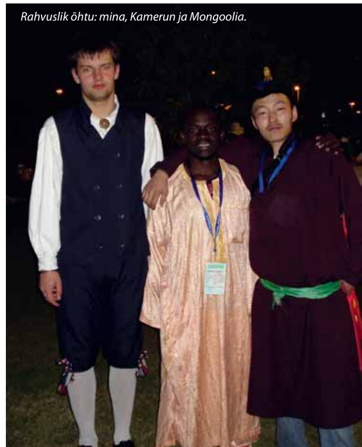
Rahvuslik öhtu: mina, Kamerun ja Mongoolia.

Kohale jõudnud, saime kõigepealt võimaluse reisiväsimus välja magada. Keskpäeval ärkasin, käisin registratuuris ja uurisin lähemalt laagriala. Siis oli kohale jõudnud juba umbes 30 rändurit eri riikidest. Laagri ees oli suur lippudega ääristatud allee, kuhu heiskasid ka ühe oma kaasavõetud lippudest. Edasine päev möödus telkide ülespanekuga ja tutvumismängudega. Telkidest veel niipalju, et need olid suured sõjaväetelgid, mille püstitasime sisuliselt kõrbesse, samas olid telkides maas vaibad ning igale oli ette nähtud raudvoodi. Öhtul hilja saime oma esimesed kingitused – spordikoti koos laagri T-särgi, mütsi, kaelaräti ja pastakaga.