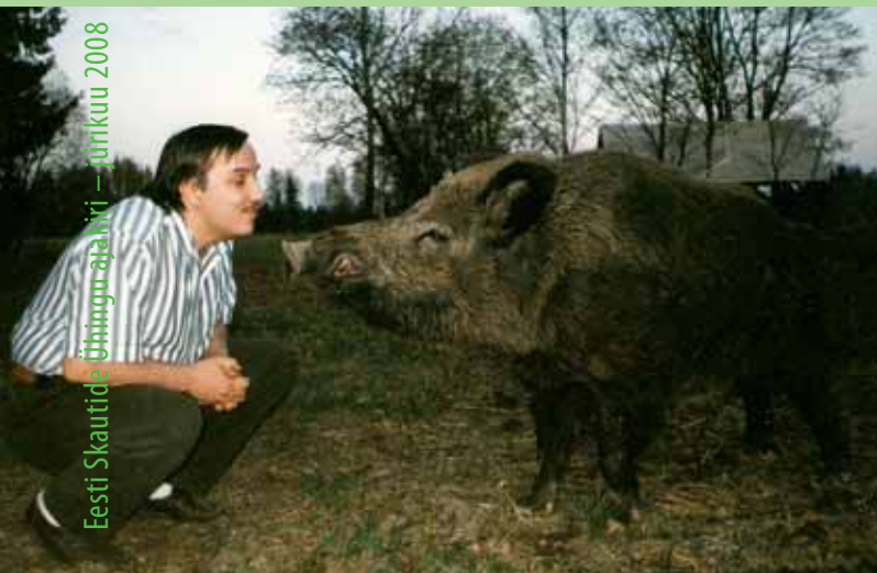
Eesti Skautide Ühingu ajakiri – juunikuu 2008

Metssiga elab meil niiskemates kuuse-, sega- ja lehtmetsas, kus kasvab rohkem põõsaid, on lopsakat alustaimestikku puude all, kust toitu leida. Teda võib kohata ka okaspuutihnikutes, sooservades, jõgede ääres, kus kasvab pilliroogu, põldude lähedastes metsades – üldse seal, kus ta leiab endale toitu ja varju. Suvel eelistab ta elada rohkem soistes leht- ja segametsades, talvel aga tihedama alusmetsaga kuusikutes.