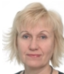
Lemme Haldre Tartu Laste Tugikeskuse juhataja, kliiniline psühholoog, psühhoterapeut

Iga peretööd tegev spetsialist, olgu ta sotsiaaltöötaja, psühholoog või vabatahtlik tugiisik, teab, et rõõmu pakub koostöö nende lastevanematega, kes on motiveeritud, avatud vastastikusele mõttevahetusele ja valmis uusi käitumisviise proovima. Selline koostöö on eelduseks, et saavutatakse oodatud tulemus.