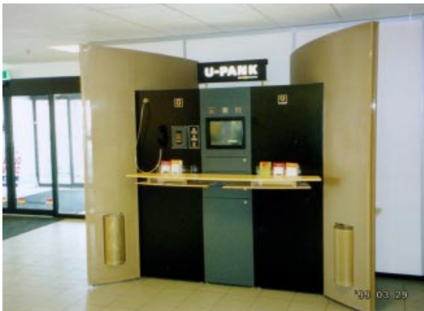
U-Pank Lasnamäel Vesse Maksimarketis

U-Pank on tootenimi, nagu seda on näiteks postipank, telefonipank või internetipank. “U-Pank” sündis `97 aasta sügisel Multikontole nime otsimise käigus. Nimi on registreeritud patendiametis Eesti Ühis pangale. 1998.a. kevadel tõime välja esimesed U-d: telefonipanga U-Liin ja internetipanga U-Net, mis pidid saama U-Panga osadeks. Ühinemisel Tallinna Pangaga tekkis panga nime vahetamise idee ja nimekonkursi käigus õnnestus klientide käest küsida ka arvamust U-Panga kohta. Panga nimeks jäi Eesti Ühispank, U-Pank saavutas teise koha. Sealt saime julguse nimetus “U-Pank” kasutusele võtta