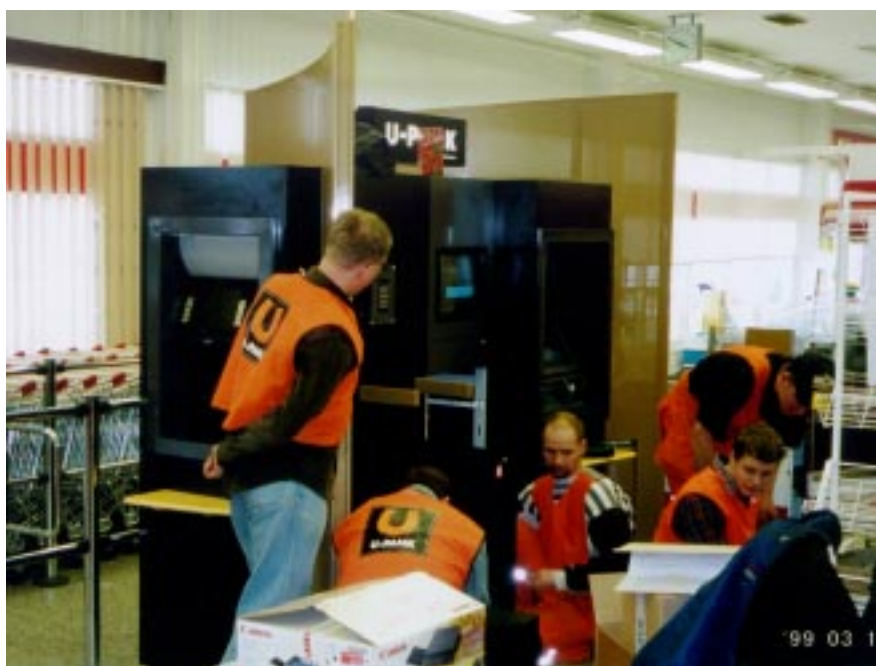
U-Panga paigaldamine Tartus, Sõpruse SPAR-is.

Algusest peale oli meil soov hoida U-Pank avatuna kahes mõttes: kvantitatiivses ja kvalitatiivses. Kvantiteedi mõttes saame me alati ATMe, infokioskeid, telefone jne. liita ja lahutada, kvalitatiivses mõttes võimaldab U-Pank liita uusi juurde-tulevaid ja täiendavaid teenuseid, nagu teenused kiipkaardi baasil, piletimüügi võimaldamine U-Pankades või mis iganes.