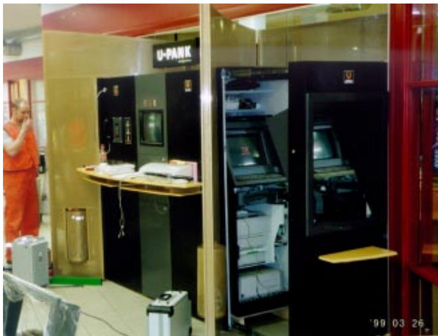
Selline näeb U-Pank seestpoolt välja.

Eesti rahvast võib hinnata kui suhteliselt innovatiivset rahvast ja Eesti pangandus on sammumas ühte jalga Lääne juhtivate finantsasutustega. (1998.a. esimesel poolel tegutses Euroopa pankade juures 28 internetipanka, neist 5 olid Eesti pankade internetipangad). Eestis on arenenud sidesüsteemid. See annab Eestis tegutsevatele firmadele märkimisväärsed võimalused täiustada oma tehnilisi süsteeme ja tootevalikut.