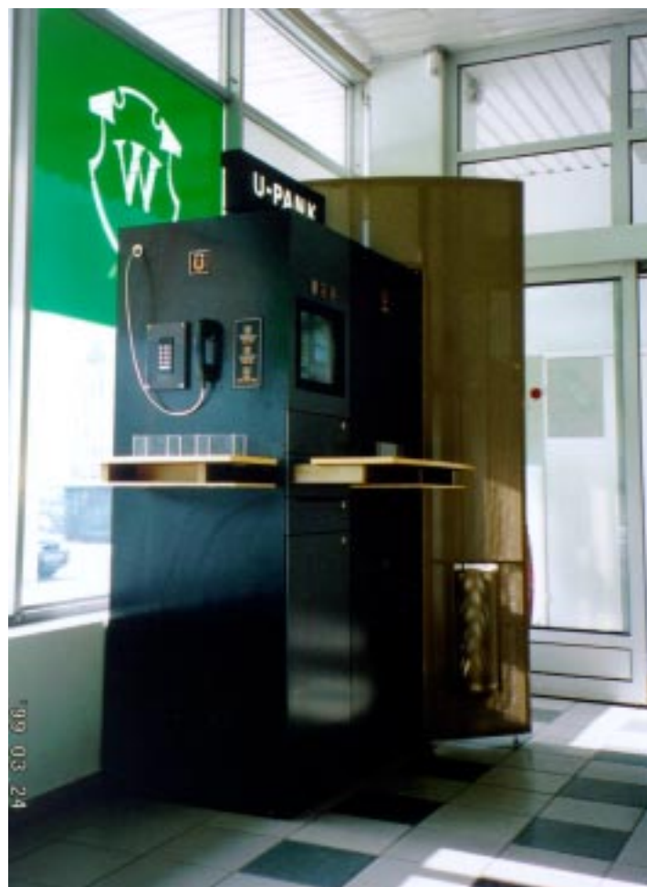
Kuna Pärnus Viiburi kaubaballis oli sularabaautomaat juba varem olemas, koosneb sealne U-Pank makseautomaadist, telefonist ja infokioskist.

mine. Kindlasti hoiame sealsetel arengutel silma peal, et kiirelt reageerida kui suurte ostukeskuste idee ka nendesse linnadesse jõuab.