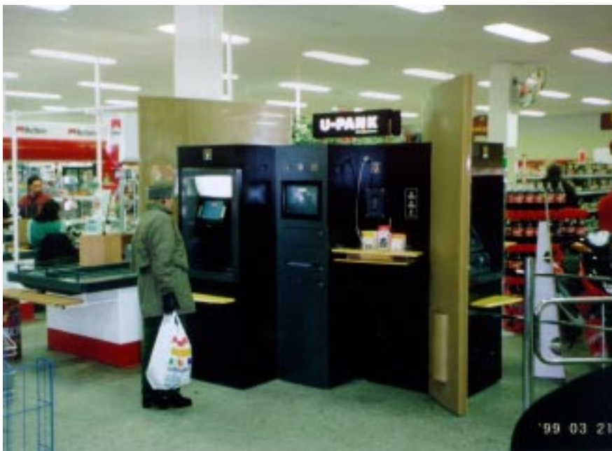
U-Pank Õismäel supermarketis Poppins (end. kauplus Järveotsa)