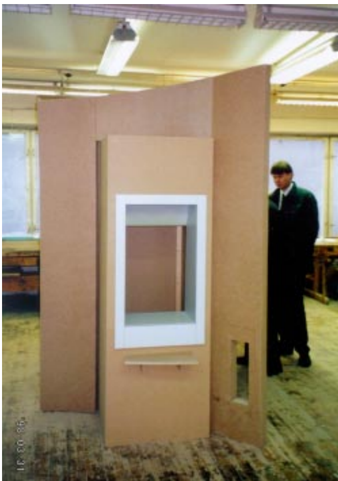
Sellise papist U-Panga maketi juures käis U-Panga meeskond assistenti-klienti mängimas.

Põhimõtteliselt teeb pank klientidele ettepaneku hakata iseenda telleriks. Ja pank on nõus sellesse investeerima. Investeerima U-Panga võrgu loomisse, mis peaks aja jooksul panga efektiivseks rahaasutuseks muutma. Ühekorraga parandame me nii oma sularahaautomaatide võrku kui avame võimaluse parandada ja optimeerida teenindussaalide võrku. Lõplikud töed ja reaalsed tulemused selguvad loomuli-