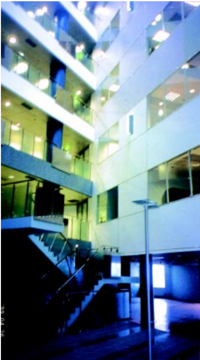
Uues majas avatavas pangasaalis rakendatakse uut teeninduskontseptsiooni.