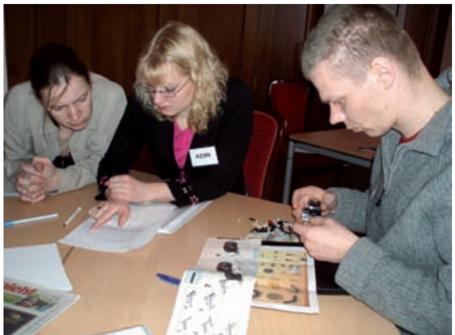
Ülesande lahendamine tingimustes, kui juhendis ei kajastu, kes peab juhtima.

Koolitaja roll on olla õppimist soodustava dünaamilise õhkkonna looja ja protsessi juhtija.