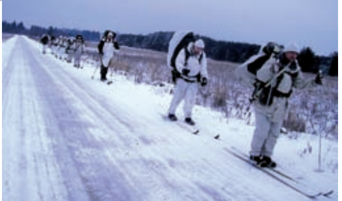
Et jagu saaks suuskadel võimalikult kaua ja kaugele liuelda, peab ülem jälgima sõidu ja puhkepeatuste rütmi, suuskade määrimist, meeste vedelikutarvitust ja veel tuhandet pisiasja.

Erilist tähelepanu peab pöörama jalgade hügieenile. Kuigi see võib tunduda ahistamisena, peab jaoülem isiklikult kontrollima igal õhtul iga mehe jalgu. Habet aetakse õhtul, et öö jooksul tekiks nahale loomulik kaitsekiht. Ja veel kord – hoidke joogivett ja kasutage pesemiseks lõkkel soojendatud sulavett.