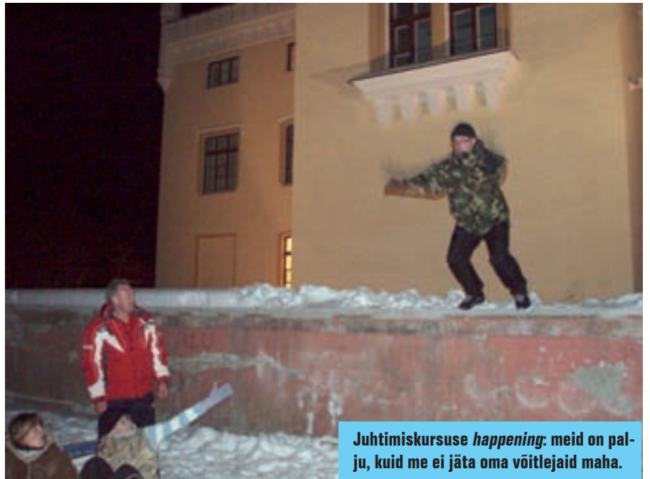
Juhtimiskursuse happening: meid on palju, kuid me ei jäta oma võitlejaid maha.

K aitseliitu on tema arendamisel aidatud paljude üksikisikute ja organisatsioonide nõu ja jõuga nii kodumaalt kui ka piiri tagant. Oleme õppinud võimete kohaselt, ja mulle tundub, et praegu on suurimaks saavutuseks organisatsiooni säilimine. Kas suudame organisatsiooni säilitada ka edaspidi, kui poliitikute ja muude huvirühmade mõjul on ellu viidud kõik need muudatused, mis juhivad meid õitsengusse, suurendavad läbipaistvust ja muudavad Kaitseliidu hõlpsamini kontrollitavaks, seda näitavad lähiaastad. Lootkem, et tõmbetuultes säilib siiski niisugune põhiväärtus nagu vabatahtlik initsiatiiv.