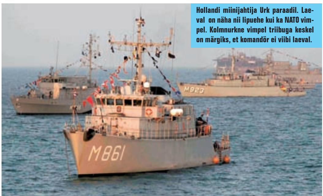
Hollandi miinijahtija Urk paraadil. Laeval on näha nii lipuehe kui ka NATO vimpel. Kolmnurkne vimpel triibuga keskel on märgiks, et komandör ei viibi laeval.

Staabi nimel tänan kõiki projekti- ja “Paraad 2006” mis tahes viisil liitunud inimesi nende kõrge professionaalsuse, abivalmis ja mõistva suhtumise ning tahte eest anda oma panus mereparaadi edukaks läbiviimiseks. KK!