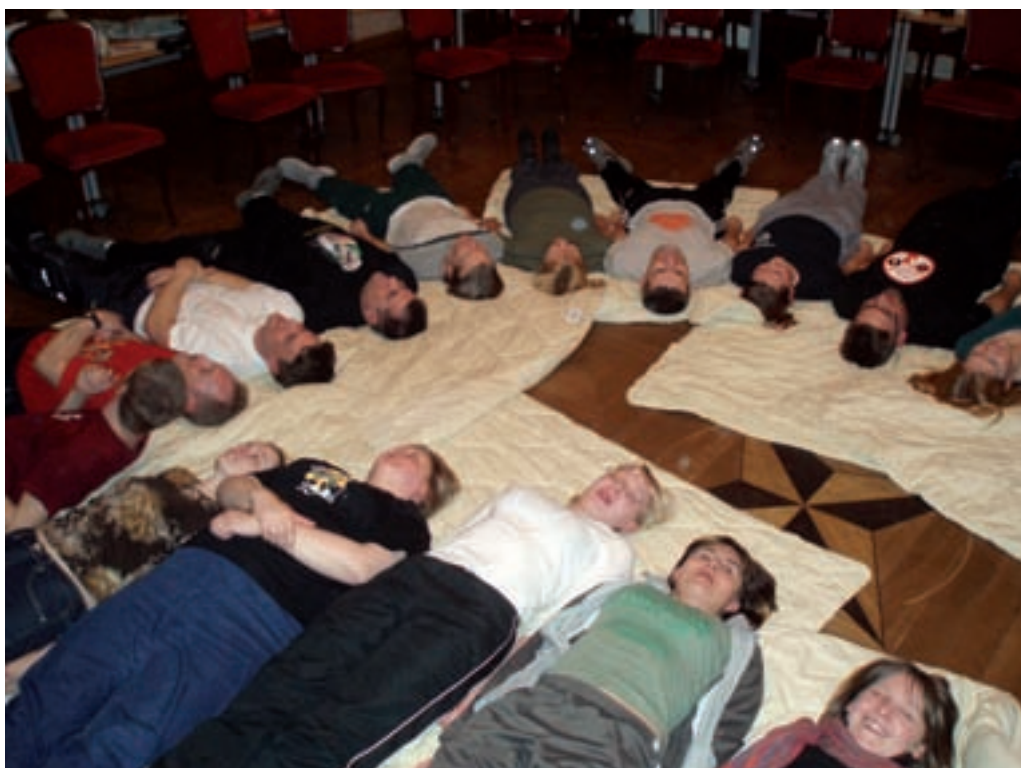
Auastmetärnid on jäetud ukse taha. Juhtimiskursuse kuulajad lõdvestumas kui üks mees uute kursuste ootuses.

2007. aastast püüame lülitada aastaplaani nädalavahetusekursused "Juhtimine praktikas" I ja II. Need