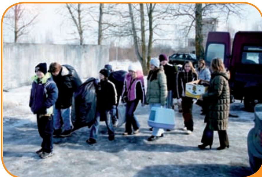
Konguta algkooli 5. klassi kogutud annetusi andis lastel Tartu loomade varjupaika tassida.

Saime teada, et uuest aastast on varjupaik Eesti Loomakaitse Seltsi hoole all ja sügiseks peaks olema palju muutunud. Abi on aga alati teretulnud. Võtsime ülesandeks koguda tekke, mänguasju ja raha