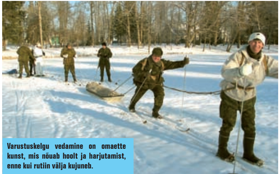
Varustuskelgu vedamine on omaette kunst, mis nõuab hoolt ja harjutamist, enne kui rutiin välja kujuneb.

Kursuse raskuspunktiks olid talvised eripärad. Toimingud ju jäävad