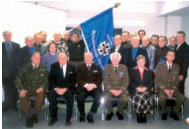
Admiral Johan Pitka Relvavendade Ühendus oma uue lipuga Kaitseliidu Tartu malevas 2005. aasta jõulude eel.

Tänavu saab üheksa veterandi parandada tervist Raplamaal Seli tervisekeskuses. Suvel külastatakse Pitka