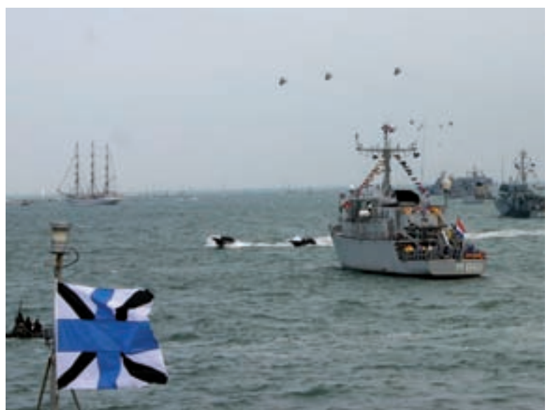
Lipuheiskamine mereväe miiniraaleril Vaindlo. Laev ise on lipuehtes.