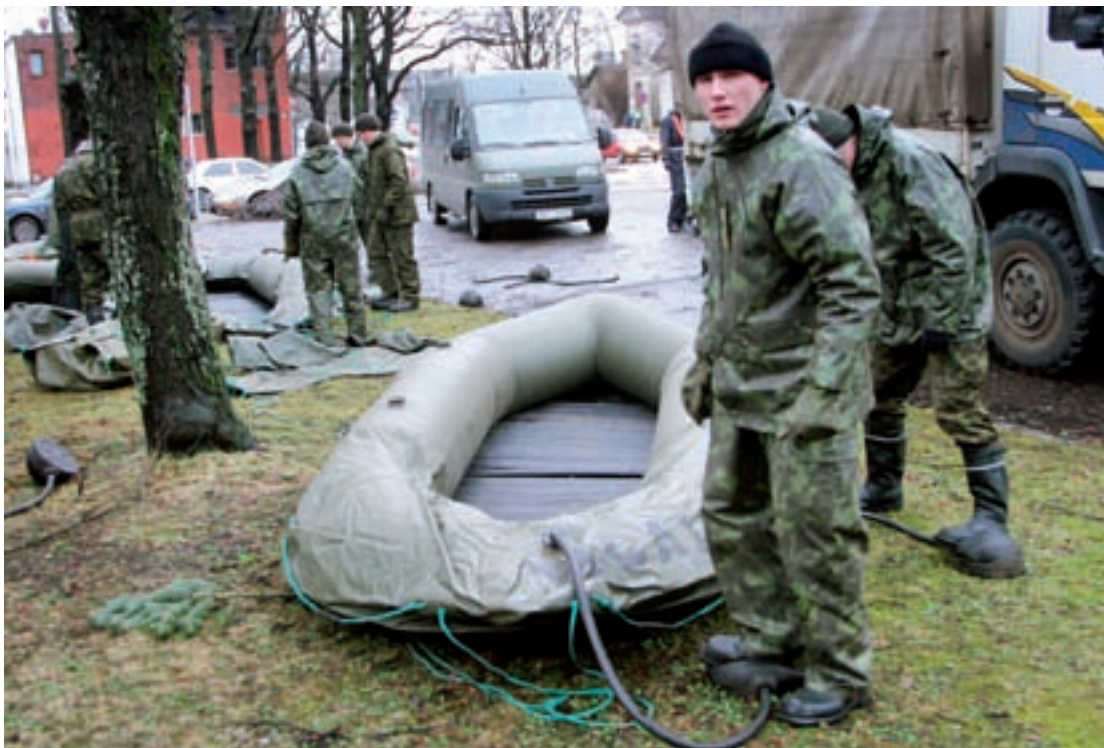
Tagalapataljoni kaitsevälased seavad lahingukorda Rootsi kummipaate, mis sobisid ainsana liikumiseks seal, kuhu autod enam ei pääsenud. Tartlased ei saanud oma mootorpaate, mis nüüdseks on (ilma kärudeta!) Tapale viidud ja seal turvaliselt virna laotud, vette lasta, sest Pärnu tänavatel polnud nii sügavat vett. Kasutamata jäi ka Tapalt kohale toodud amfiibveok. Aga olgem õnnelikud, et kohal oli rohkem vahendeid kui tarvis läks, mitte vähem.

Oma rolli edasiste sündmuste mõnevõrra ebaloogilises arengus mängisid ilmaennustajad. Nimelt ennustasid mitmed ilmatargad, et olukord teravneb taas, või veelgi hullem, õige tormi kõrghetk saabub alles järgneval ööl. Kes teist tahaks olla selle inimese nahas, kes peab otsustama, kas uskuda seda hoiatust või mitte.