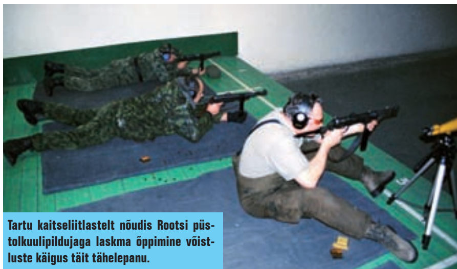
Tartu kaitseliitlastelt nõudis Rootsi püstolkuulipildujaga laskma õppimine võistluste käigus täit tähelepanu.

Eelteates nimetatud tankitõrjegranaadiheitja alakaliiber osutus hoopis Rootsi püstolkuulipildujaks. Et tartlased seda relva varem proovinud polnud, sai laskmisel lamades, põlvelt ja püsti üksjagu nalja ning