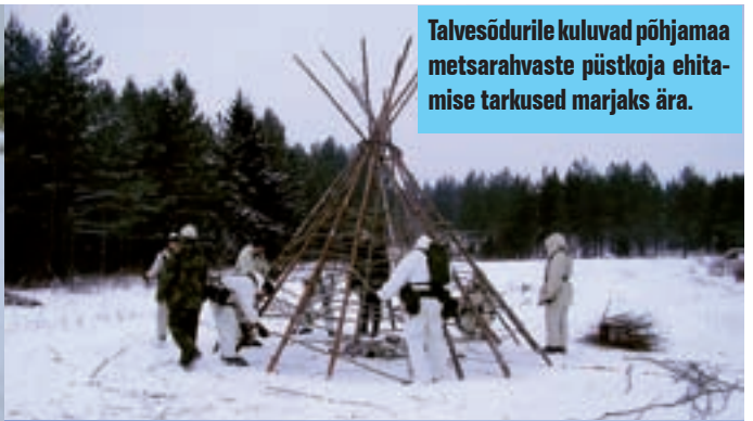
Talvesõdurile kuluvad põhjamaa metsarahvaste püstkoja ehitamise tarkused marjaks ära.

Kui keegi peaks läbi jää vajuma, viskab ta seljakoti maha ja veeretab ennast tuleku suunas tagasi. Liikumisel kasutatakse julgestusköit. Vette sattunu peab ennast jääle tõmbamiseks kasutama teravaid esemeid, nagu naasklid, nuga või suusakepid. Ülejäänud abistavad teda, viskudes maha suuskadele ja sikutades abivajaja kõie abil jääaugust välja. Seejärel tuleb anda esmaabi – vahetada vettekukkunu riided, katta ta soojalt ja anda kuuma jooki.