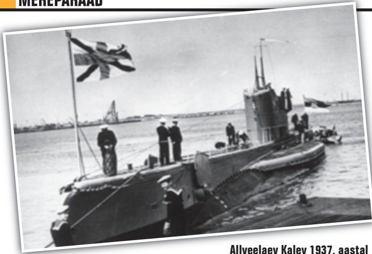
Allveelaev Kalev 1937. aastal kodusadamas. Uhkelt lehvivad nii güüs kui ka ahtrilipp, mastis on näha sõjalaeva vimplit. Tagaplaanil ahtrilipuga paat.

on teda võimalik muul viisilgi kui lippudega välja kutsuda. Kutsungid on rahvusvaheliselt üldaktsepteeritavad ja nende esimesed tähed näitavad laeva riiklikku kuuluvust. Eesti laevadel on see ES ehk Echo-Sierra ja siis veel kaks tähte. Mereväe lipulaeval Admiral Pitka on need QF ehk Quebec Foxtrot .