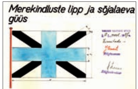
Üleval: Eesti esimene kinnitatud sõjalaevalipp. All: Eesti Vabariigi valitsuses 1927. aastal kinnitatud güüsi (kasutamiseks sõjalaeva võõrilipu ja merekindluste lipuna) kavand.

saabuja pooled kindlaks määratud aupaukudest, siis vastab vastuvõtja. Paraadidel vastastikust laskmist pole, sest need korraldatakse teatud sündmuse auks ja aupaugud on ära teeninud enamasti riigipea. See, kui palju pauke ja millise ajavahega lastakse, sõltub tervitatava tähtsusest. Kõige tähtsam on 21-lasuline nn rahvussaluut riigi või riigipea auks. Praegu kasutatakse peamiselt 40 mm saluudikahureid, kusjuures mürsud laaditakse nii, et pärast lasku oleks näha ka suitsu ja tuld.