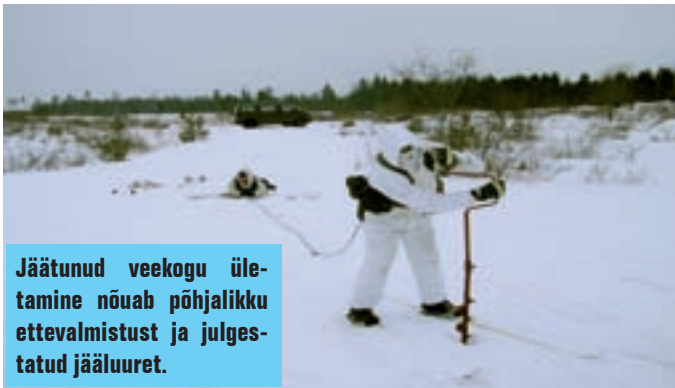
Jäätunud veekogu ületamine nõuab põhjalikku ettevalmistust ja julgestatud jääluuret.