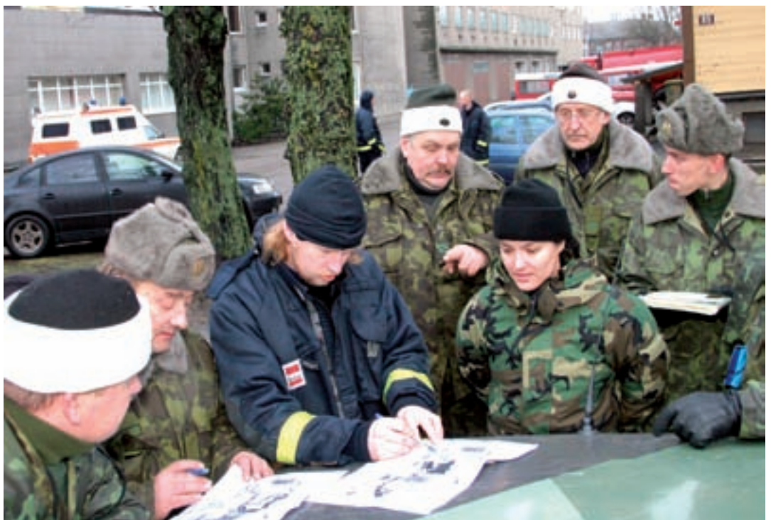
Tartu kaitseleitlased ja kaitseväelased päästetöödel abiks olles peame harjuma sellega, et käsuandjaks ei pruugi olla sõjaväelane ja ka ülesande andmise vorm ei pruugi ühtida meile harjumuspärase standarditega. Oluline pole käsu andja isik ja käsu andmise viis, vaid see, et tarvilik töö saaks tehtud.

Olgu komisjon kui tark tahes ja kapitais plaane uut kriisi ootamas, otsustavaks faktoriks kujuneb ikka üks – see on inimene. Mulle andis selle kriisi reguleerimise juhtimises osalemine ühe kogemuse: meil on jätkuvalt palju tublisid ja tarku inimesi, kes suudavad end raskel hetkel kokku võtta ja teha, mida vaja. See annab lootust, et saame üheskoos üle hullematestki asjadest kui ühe väikese mereäärse linna märjad varbad. KK!