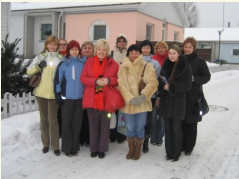
Sotsiaaltöötajad Keila SOS Lastekülas

8. märtsil allkirjastasid SOS Lasteküla Eesti Ühingu ja Lastekaitse Liit koostöölepingu, et