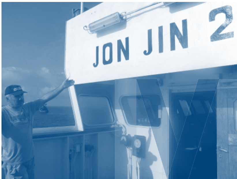
Kaaperdajate poolt laeva hõivamise järel Arctic Sea kaptenisillale kirjutatud laeva uus nimi.

davad, nad osalevad Somaalia vete seires ja WFP laevade eskortimises. Augustist 2009 toimunud operatsiooniga „Ocean Shield” abistati selle piirkonna riike nende oma piraatlusevastase võitluse suutlikkuse arendamisel.