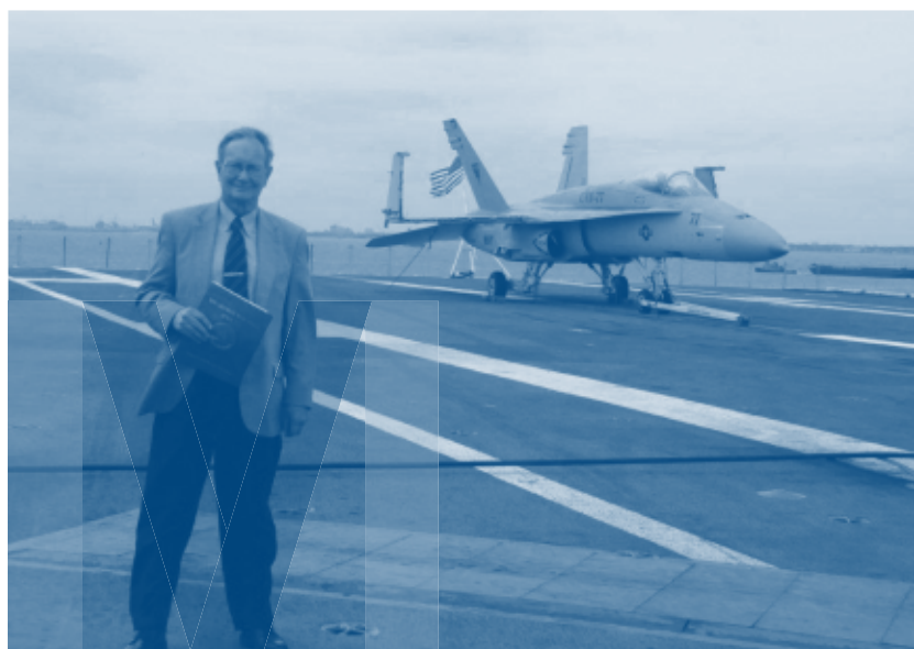
Norfolki sõjalaevastikubaasis uusimal USA lennukikandjal George Bush.

Valge Maja huvi Euroopa vastu on selgelt kahanenud. Paljude mõtteviis USAs näikse olevat just selline – soovisite olla tugevad ja ise hakkama saada, tuginege siis omaenda kaitsepotentsiaalile, meil on küllaga tegemist mujal. Ameerika on ikka võõristanud ELi jagatavat suveräänsusmudelit, mille süvenemist Lissaboni lepe kavandab. USA esindajate silmis on just riikliku suveräänsuse tagamine kogu kaitsepoliitika alus ja eesmärk. ELi tajutakse suhteliselt ebamäärase kooslusena, kellel deklaratsioonidele vaatamata puudub ühtne välispoliitika ning kelle kavandatav EJKP näib ühest küljest ebatõhusana, teisest küljest aga NATOga mõttetult rivaalitsevana ning