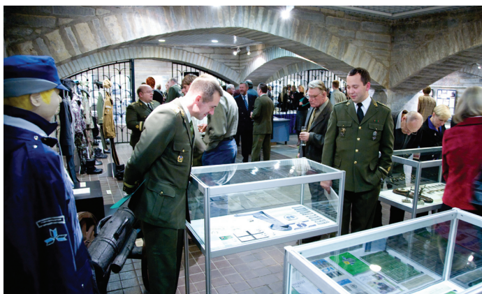
Külalised näitust uudistamas