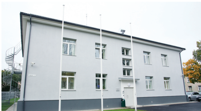
Kirde Piirivalvepiirkonna staabihoone