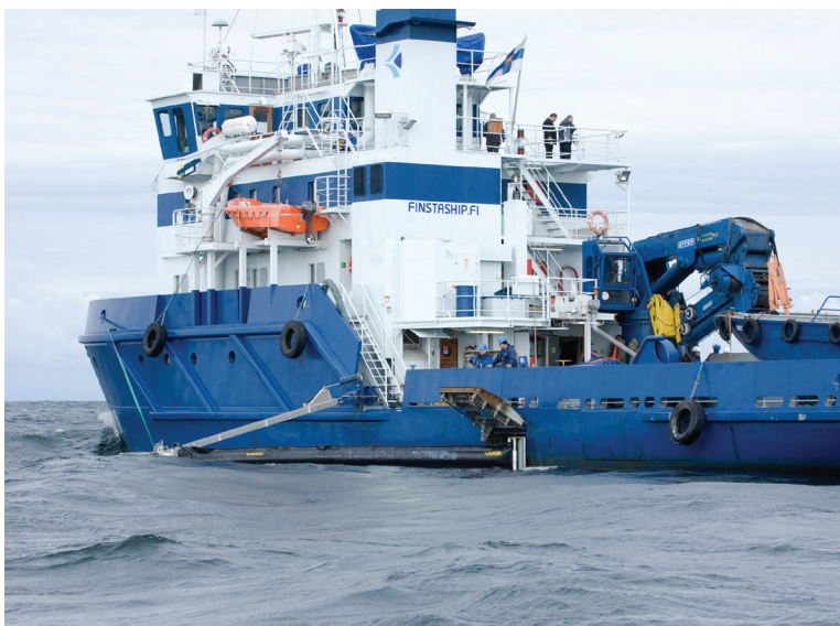
Soome reostustõrje laev Seili imiteerimas reostuskorje töid