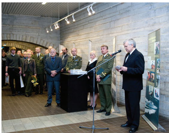
Näituse avas siseminister Jüri Pihl