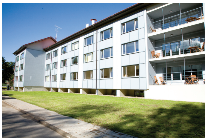
Sisekaitseakadeemia Piirivalvekolledži majutushoone