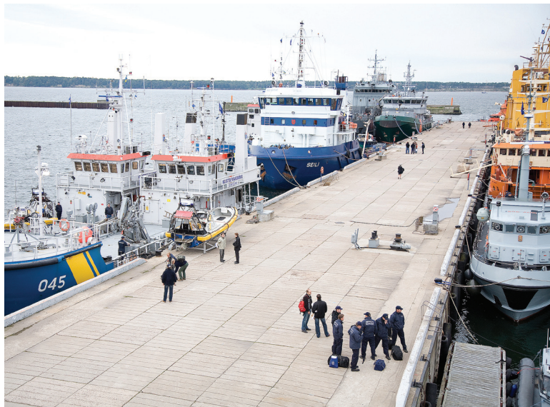
Balex Delta õppusel osalenud laevad piirivalve sadamas

Õppuse üldjuht Lääne Piirivalvepiirkonna ülem Alvar Vallau sõudevõistluse võitnud Poola meeskonda austamas