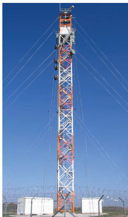
Terepniki radaripositsioon maksis 30,6 miljonit krooni

Teist samaladset radaripositsiooni Progress testiti Narva-Jõesuu ja Narva vahel.