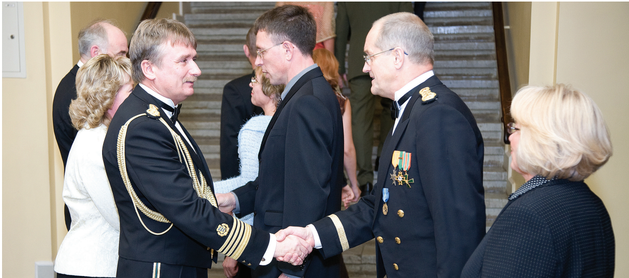
Peadirektor külalisi vastuvõtmaks