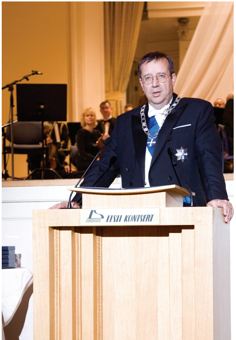
Vabariigi President Toomas Hendrik Ilves piirivalve juubeli galaõhtul Estonia Kontserdisaalis

1991. aasta augustis piiri veel niisama hästi kui polnudki. Piiripunktide aset täitsid soojakud, ähvardavaim relv oli kumminui. Jutud elektroonilisest valvest, infrapuna-anduritest või päästehelmitest oleksid toona kõlanud ulmeloona.