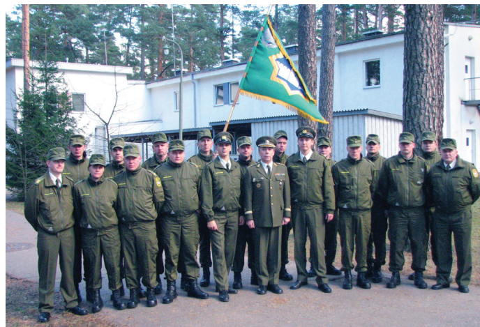
Valmidusüksuse I lend

kuna edaspidi on see oluline täiendõppe vorm ning edutamise eeltingimuseks.