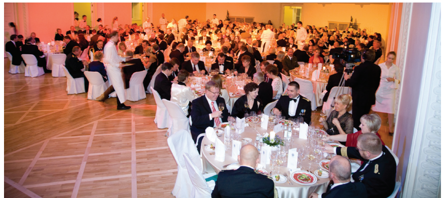
Külalised kiitsid Estonia Kontserdisaalis valitsenud pidulikku õhkkonda