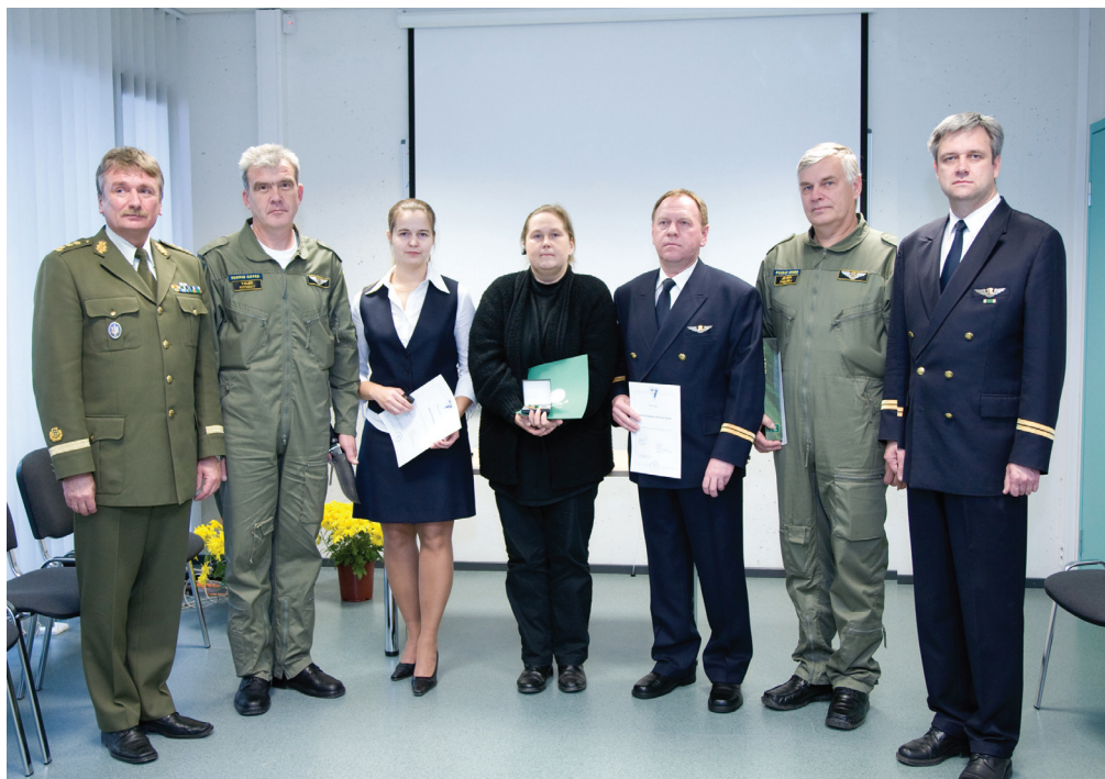
Vastuvõtul tunnustuse saanud ühispildil.

Pärast ametlike autasude ja tunnustuste jagamist said kõik lennusalga töötajad peadirektoriga suheldes positiivse laengu ning tahtmise edaspidigi väärikalt töötada. Oli meeldiv võimalus hetkeks lõogastuda ja veidi tagasi vaadata.