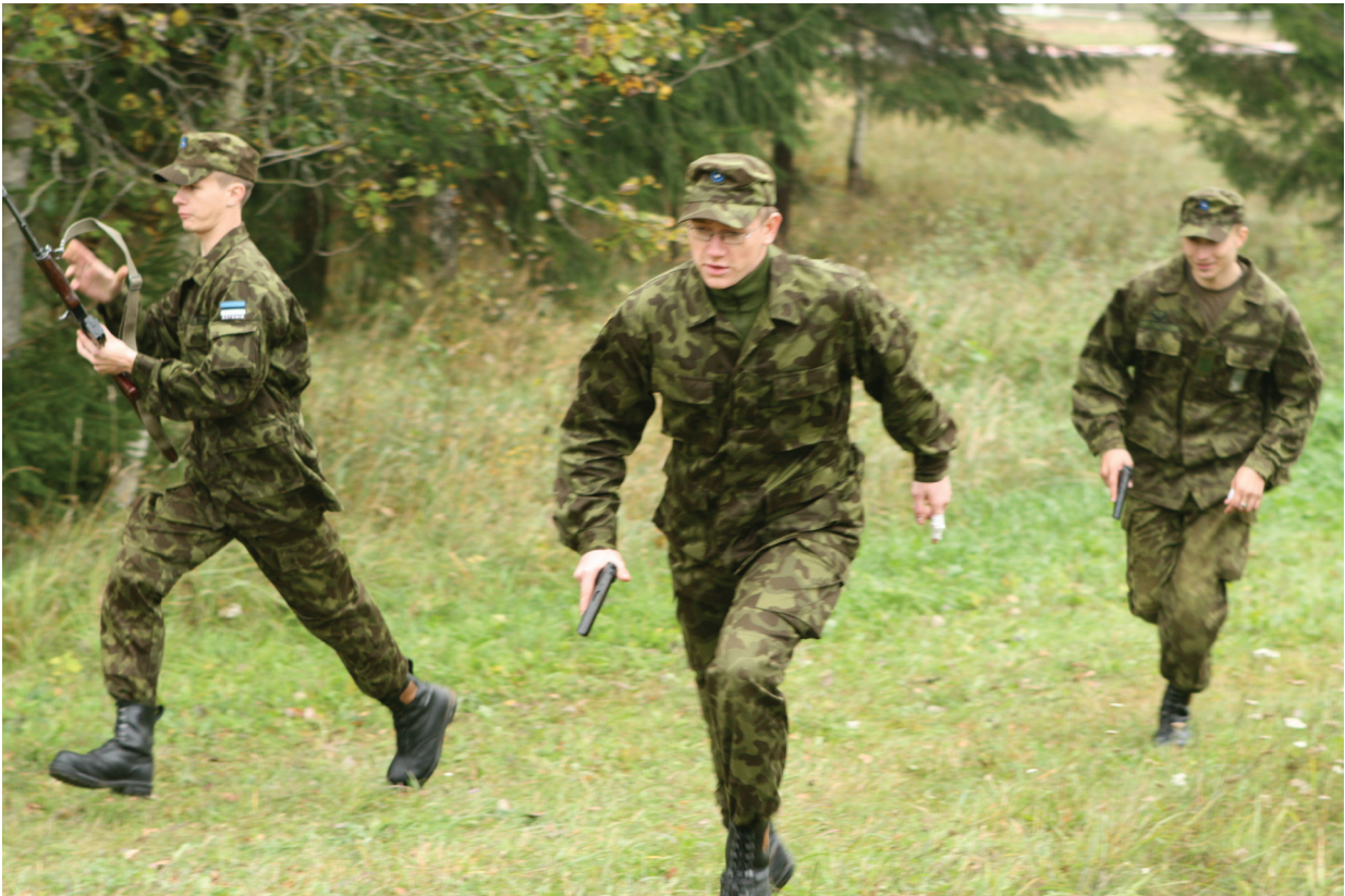
Piirivalve kadetid järjekordset harjutust sooritamast

piirivalvekadett, rakendusliku kõrghariduse BS060 õpperühma ülem