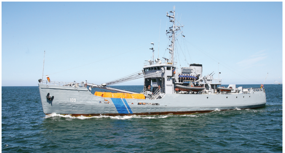
Merepäästeõppusel osalenud PVL 109 Valvas.

Õppus toimus kahes etapis. Esimeses etapis otsiti veest väikelaevaõnnetuses kadunuks jäänud inimesi, teise eesmärgiks oli õnnetuses oleva laeva abistamine. Õnnetusse sattunud laeva imiteeris Soome piirivalvelaev Merikarhu. Harjutati tulekahju kustutamist, pukseerimist, lekke kõrvaldamist, evakuaatsiooni põlevalt laevalt ja abi osutamist kannatanule. Uueks elemendiks oli merereostuse tõrje, mida harjutasid õppusel osalenud Soome piirivalve alused.