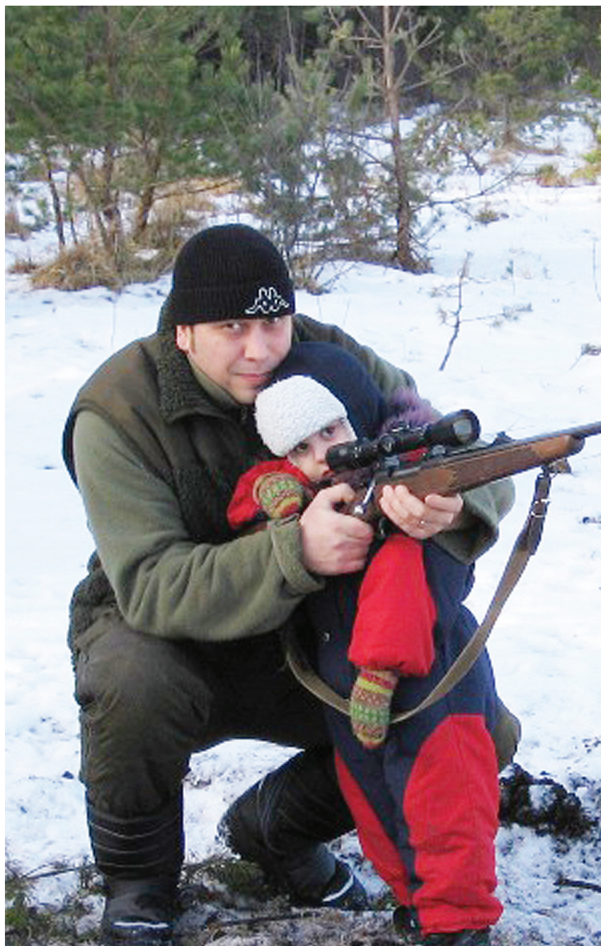
Jahimehest isa tutvustab kaasahaaravat harrastust ka pojale

Metsale lähemal olemiseks sõidab nädalavahetusel muidu Kuressaares elav Haamerite pere oma maamajja Pärsamale. Seal