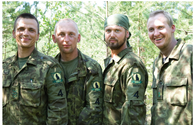
Piirivalve võistkond Erna retkel

Tagntjärele on meeskond omavahel analüüsinud, et tegelikult oli võistlus täiesti võidetav. Abiks oleks olnud natuke rohkem sportlikku õnne ja pisut vähem enese laiskust, mille koosmõjul saadi karistuspunkte lihtsate asjade eest. Kokkuvõttes jäid aga mehed oma tulemusega rahule.