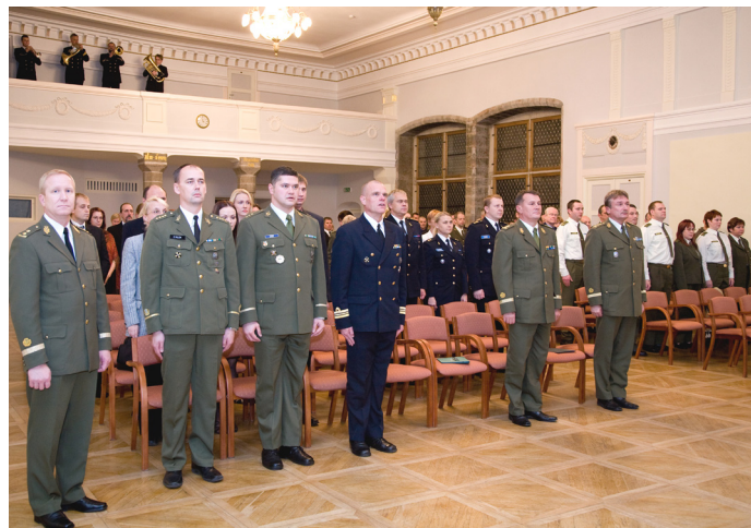
Põhja Piirivalvepiirkonna vastuvõtul osalejad hünni laulmas