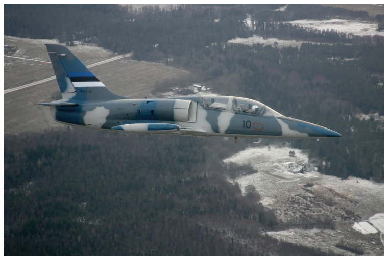
Piirivalve lennuki aknast avanenud vaade Õhuväe õppehävitajale L-39, mis on saavutanud kontakti „kaaperdatud” lennukiga.

Soodsat olukorda lennukis oma tegevus läbi mängida kasutasid mitmed siseturvalisust tagavad asutused. Pärast lennuki sundmaandumist harjutas eritiüksus lennuki vabastamist terroristidest, Kaitsepolitsei sai kätt proovida sellise kriisi lahendamise juhtimisel ning militaar- ja tsiviilkiirabi harjutasid omavahelist koostööd. Kõik see oli eelmänguks järgmisel aastal toimuvale suurõppusele, kus lisaks eelpool mainitud tegevustele mängitakse läbi ka käsuliinid, sündmuse juhtimise üleminek ühelt ministeeriumilt teisele ning kriisireguleerimise staabi moodustamist.