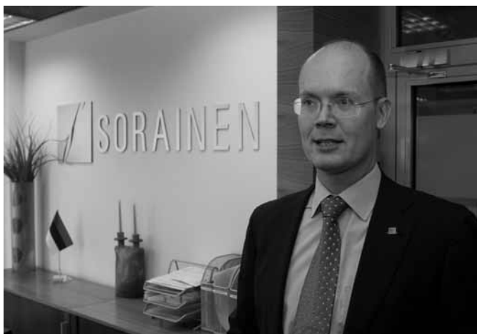
Advokaadibüroo SORAINEN on Kaubanduskoja liige aastast 1997.

1997. aastast Kaubanduskoja liige olnud advokaadibüroo SORAINEN võitis juba kolmandat korda Baltikumi Aasta Advokaadibüroo auhinna. Baltikumi Aasta Advokaadibüroo tiitel omistati SORAINENile maailma juhtiva finantsõigusturge hindava väljaande International Financial Law Review (IFLR) Euroopa auhinnatseremoonial 22. märtsil.