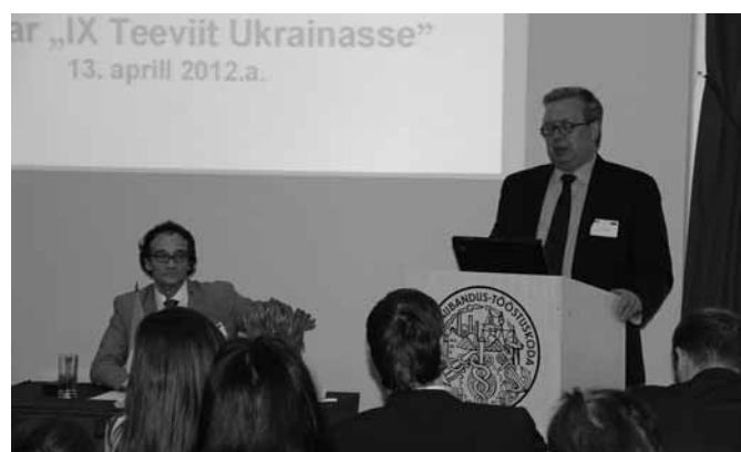
Kohtumine Sillamäe sadama ja AS-i Molycorp Silmet juhtkonnaga.

Kutsehariduskeskuses, kus kohtumisel ettevõtjatega räägiti saatkondade võimalustest aidata siinsetel firmadel välisriikidest ärikontakte leida, aga ka erinevate riikide ettevõtlikliimast ja ärikultuurist ning muudest organisatsioonidest, kelle abiga pakkuda oma tooteid ja teenuseid välisriikidele. Kohtumisel osalenud Välisministeeriumi esindaja tutvustas Eesti välis- esindustest poolt ettevõtjatele pakutavaid teenuseid. ■