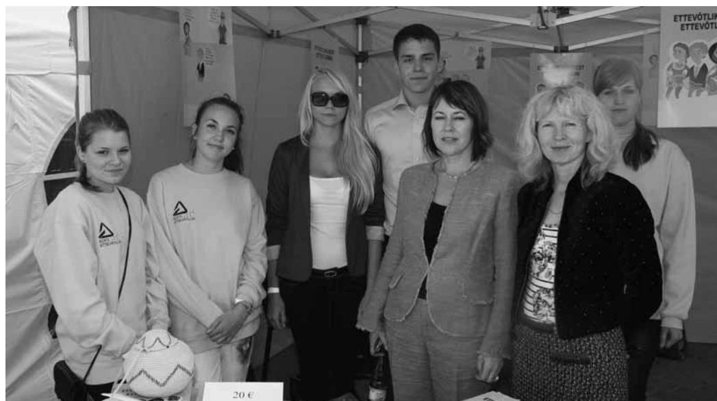
Õpiku toimetuse liikmed.

Isegi alles n-õ toorikuga tutvumisel olid õpilaste hinnangud positiivsed, näiteks: „Üldiselt arvan, et õpik on väga õpilasesõbraliku tekstiga, sest kõik on ilusti jutustavalt