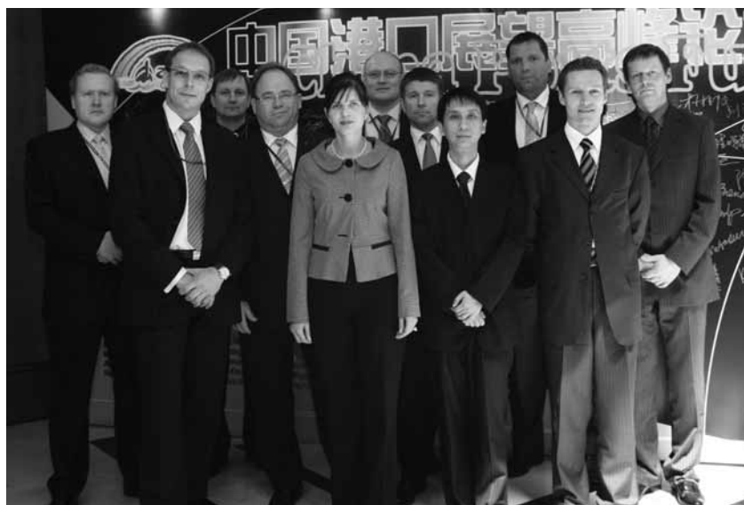
Eesti delegatsioon konverentsil China Ports Future.

Asjatundjate hinnangul vähendaks see transpordikulu ja lühendaks tarneaega. Ka jätkusid Tallinna Sadama läbirää-