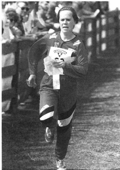
Küllil Oslo etapi finišisirgel

Nimetatud 4 võistlust olid kõik erinäolised ja metsa- ning asula- ja pargiorienteerumise osakaal oli neis erinev. Kuid igal pool pakuti pealtvaatajatele ja pressile rohkesti põnevust. Enim meelt lahutanud episoodideks olid näiteks rinnuni vees läbi 10 meetri laiuse jõe kahlamine ja ICA-kaupluse varikatusel jooksmine Laxås, automagistraali kahekordne ületamine üle ehitustellingutest tehtud ajutise