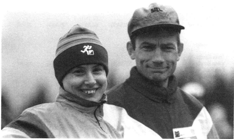
Orienteerumine on perekonnasport