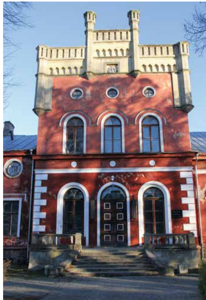
Looduskaunis kohas asuv Porkuni mõis ootab uusi omanikke.

Rakke, Tamsalu ja Väike-Maarja valdade koostööst sündinud Pandivere Arendus- ja Inkubatsioonikeskuses (PAIK). Keskuse peamine eesmärk on aidata kaasa kohaliku elu ja initsiatiivi arengule.