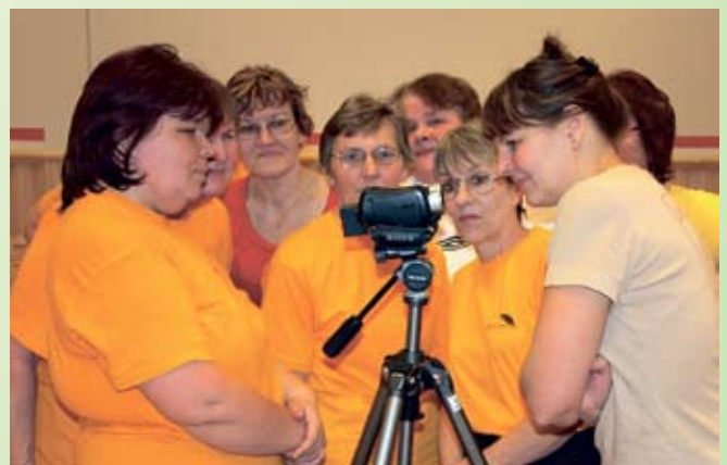
... ja tegeleti fotograafiaga. Jõgevamaa