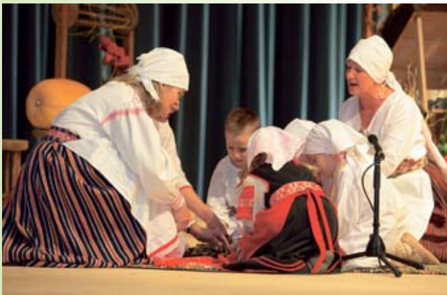
Sõnades on vägi: külalistele näidati ehedat folkloori.