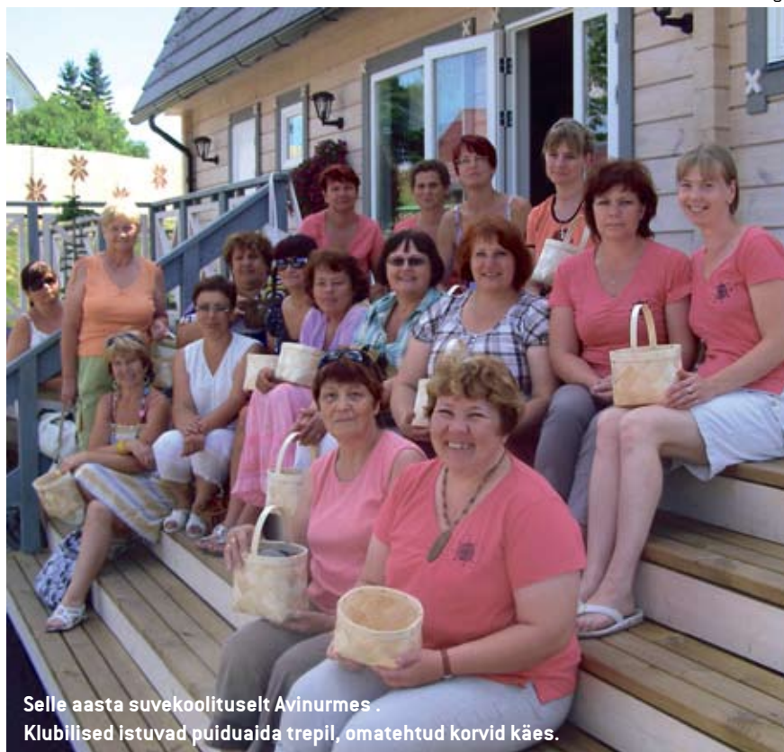
Selle aasta suvekoolitusel Avinurmes. Klubilised istuvad puiduaidal trepil, omatehtud korvid käes.

Praegu on Kolmapäev 21 liiget, kellest kümme on asutajaliikmed. »