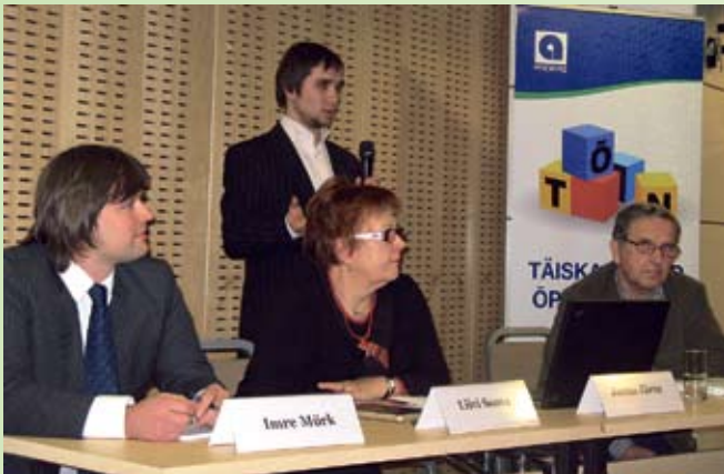
XIV täiskasvanuhariduse foorumi paneeldiskussioon. Tallinn