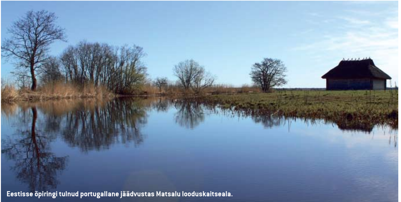
Eestisse õpiringi tulnud portugallane jäädvustas Matsalu looduskaitseala.

Teisalt aga ka võimalus koolitusasutustele, korraldamaks kursusi välismaalastele. Eelduseks on, et kursusest võtab osa vähemalt kümme soovijat kolmest riigist. Taotlus kuldade katteks tuleb esitada SA Archimedes hariduskoostöö keskusele. Mullu korraldati Eestis selliseid õpiringe kolm, tänava juba neli.