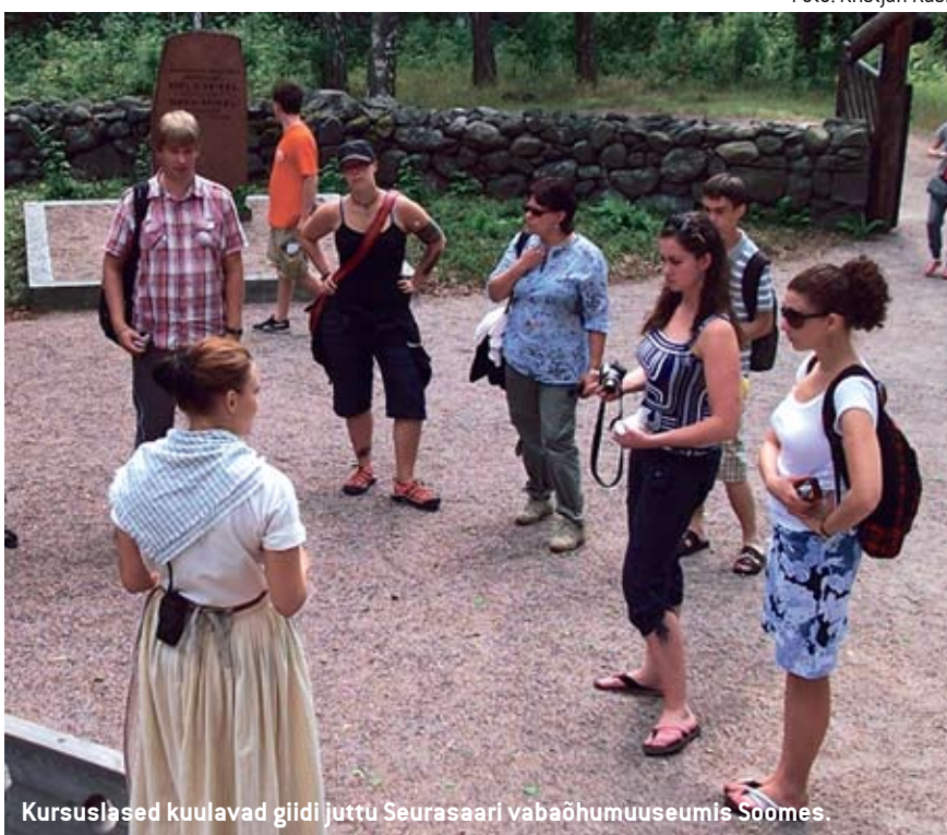
Kursuslased kuulavad giidi juttu Seurasaari vabaõhumuuseumis Soomes.