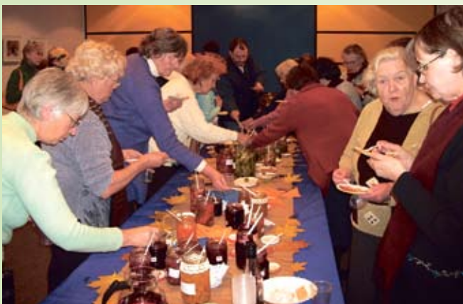
Sügis pandi üheskoos purki. Ida-Virumaa