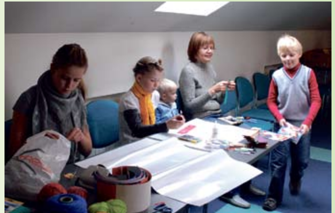
... tehti järjehooldajaid, Tartumaa