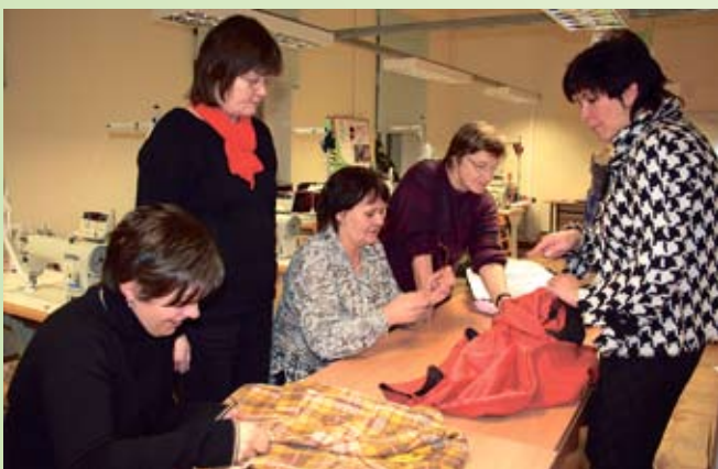
Õmblushuvilised jagavad kogemusi. Pärnumaa