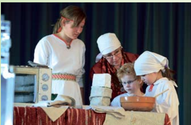
Laval küpsetatud karaskit said kõik mekkida.