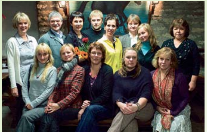
Koosõppija tiitli said Mainori kõrgkooli lõpetanud. Hiiumaa