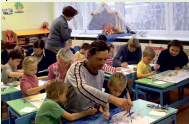
... arendati loovust, Ida-Virumaa