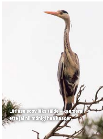
Lätlase soov läks täide – kaamera ette jäi nii mõnigi hea kaader.