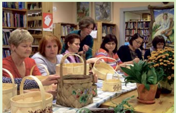
... jätkati korvipunumise traditsiooni, Põlvamaa