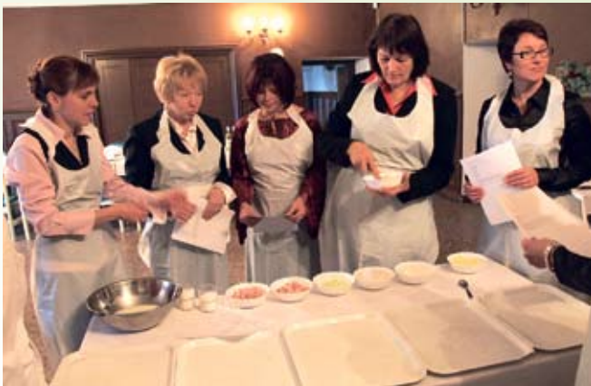
Õpitubades valmistati vanaema retseptiraamatu järgi toitu, Läänemaa