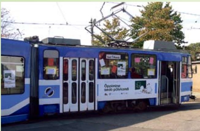
Õpitrammis jagati infot enesetäiendamise võimalustest ligi 400 inimesele. Tallinn