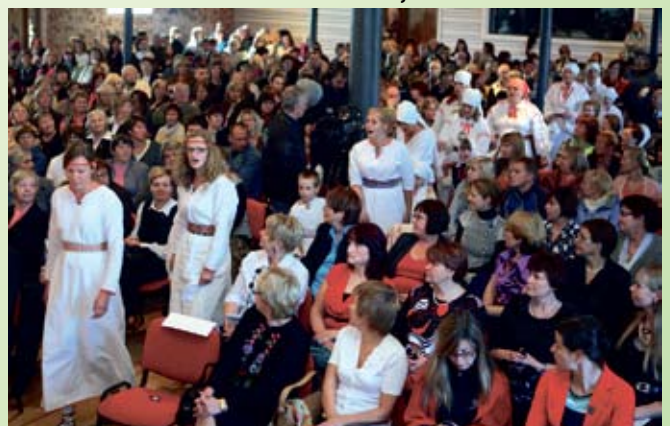
Põlva folklooriansambli Käokirjas naised, neiu ja lapsed.