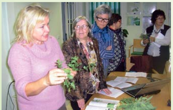
Saare naised õppisid ürtede tundma. Saaremaa