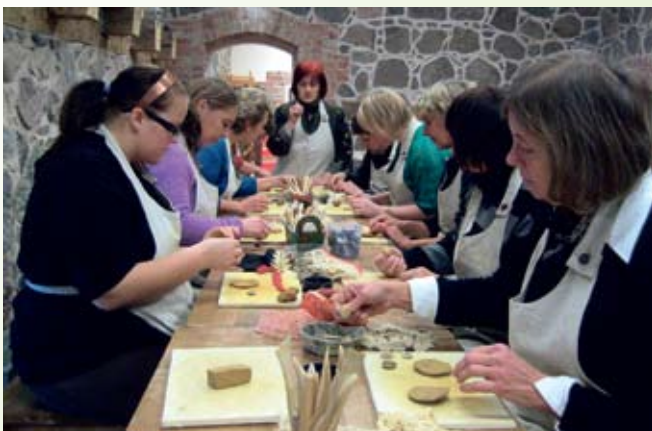
... meisterdati soovide kausse, Viljandimaa