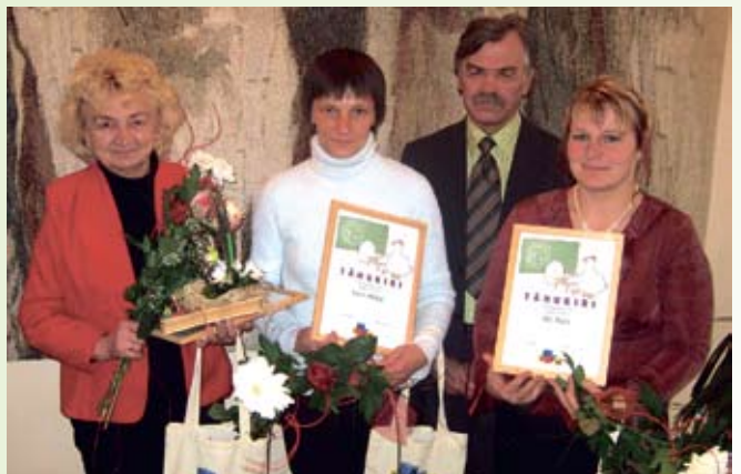
Tunnustamine teeb rõõmu. Raplamaa