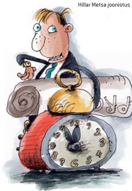
Hillar Metsa joonistus

Personaliga tegelejad nentisid, et rohkem kui kunagi varem vaatavad nad läbi sõrmede sellele, kui töötaja „jääb vahele“ töötajast õppimisega. Meil pole praegu suurt