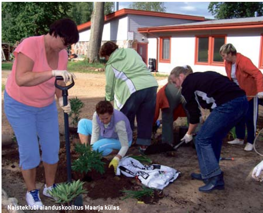
Naisteklubi aianduskoolitus Maarja külas.