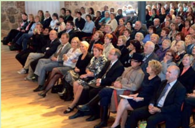
Mooste folgikotta oli kogunenud ligi 400 inimest.