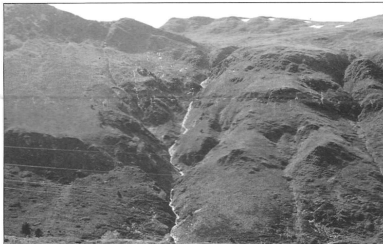
Vaade mägedele teel Püreneekest Font Romeust Andorrasse.

Meenus 20 aasta taha: Olümpiatule kandmise au kuulub vaid parimatest parimatele. Tallinn 1980.