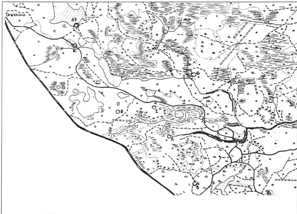
I Eesti - Leningrad matš 1960 1:25 000. 2x vähendus.