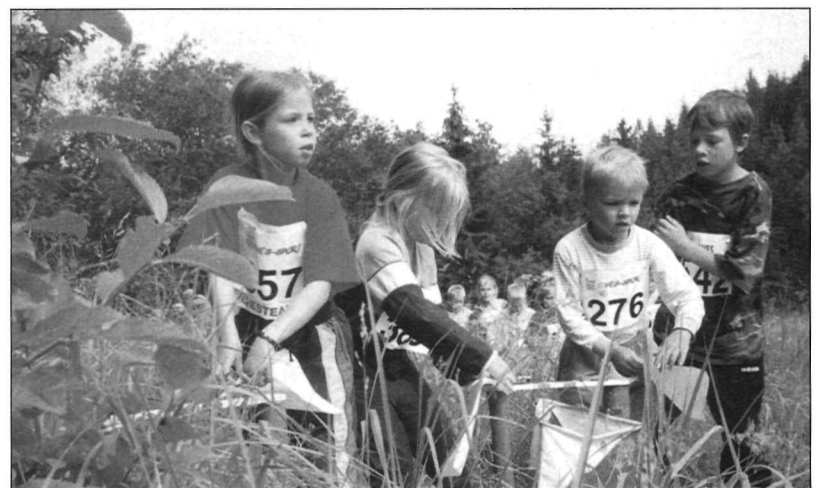
Kas siis kui need noored põhiklassides jooksma hakkavad, on kompostermärkesüsteem juba kauge minevik? Minillves 2000.