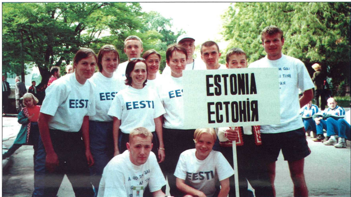
Eesti koondis Euroopa meistrivõistlustel 2000. Lk 4