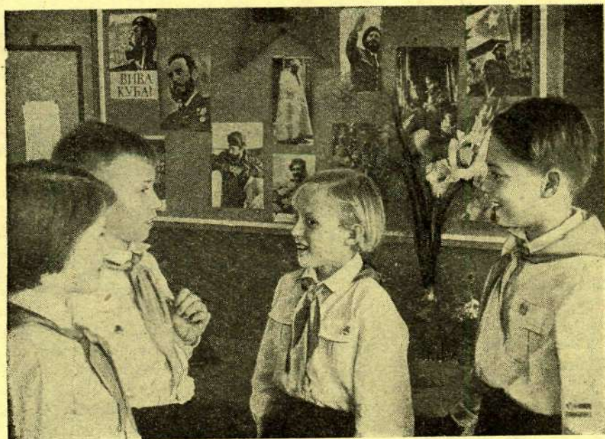
Tallinna 1. internaatkooli pioneirimaleva parim pioneerrühm — 5-a klassi rühm — kannab Kuuba rahvuskangelase Fidel Castro nime. Klassi pioneerinurgas pühendati üks stend Fidel Castrole.