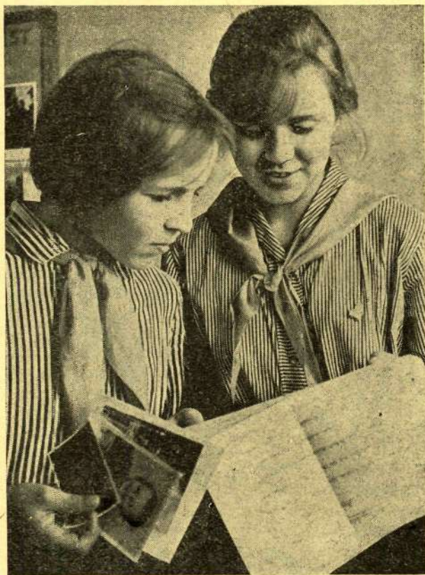
Nissi 8-klassilise kooli õpetajatel ja õpilastel on juba kuuendat aastat kirjavahetus Saksa Demokraatliku Vabariigi Adorfi kooliga. Sellest on kasu olnud nii saksa kui ka meie pedagoogidel ja õpilastel. Kogemuste vahetamise kõrval aitab see kaasa keele omandamisele.

Suur Sotsialistlik Oktoobrirevolutsioon avas tee inimkonna õnnele. Loo- tusrikkalt ja armastusega vaatab Nõukogude Liidu poole rahvusvaheline töölisklass, kogu progressiivne inimkond. Meie maa saavutused ja iga nõukogude inimese ennatsalgav töö kommunistliku ühiskonna loomise nimel omandavad üha suuremat tähtsust kogu maailma saatuse kujunemises.