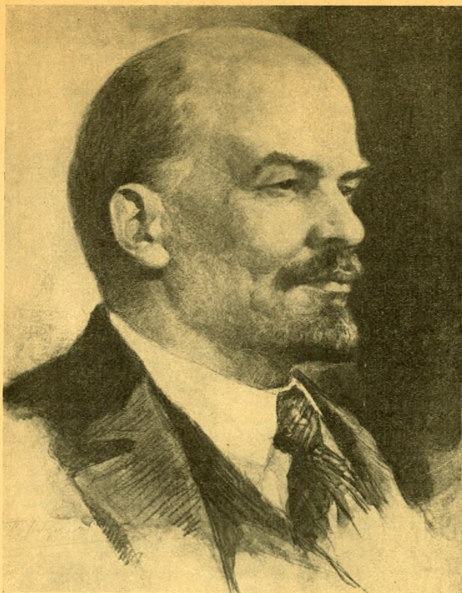
Vladimir Iljič Lenin (Uljanov).

* 22. VI 1870 Uljanovskis (Simbirskis), † 21. I 1924 Gorki külas (Moskva lähedal).