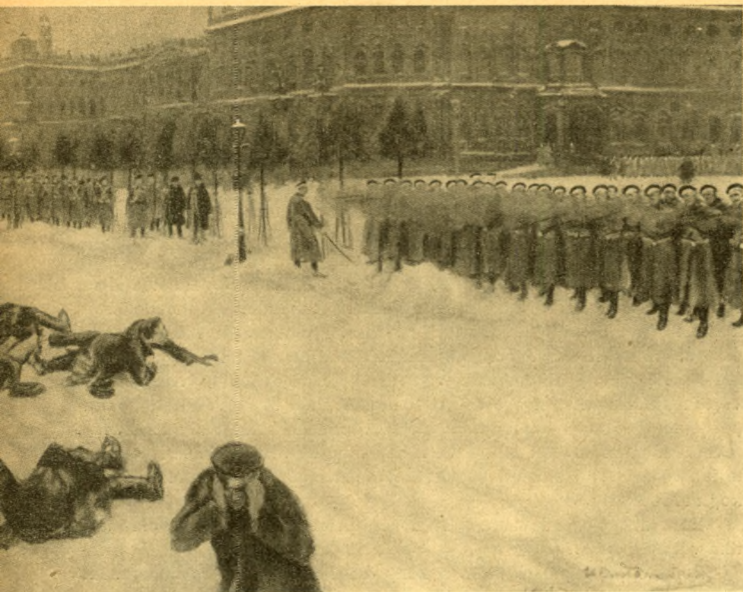
Kunstnik I. Vladimirovi maal.

partei komiteed eesotsas sms Staliniga. Streikijate hulk ulatus jaanuaris määratu suure arvuni — 440.000-ni.