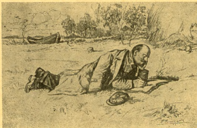
V. I. Lenin varjab ennast valgekaartlaste eest Razliv'i järve ümbruses (1917. a.)

Illegaalselt elades jätkas Lenin partei juhtimist, tegi kaastööd „Pravdale“, mis sellal mitme nimetuse all ilmus. Lenin orienteeris parteid relvastatud väljaastumisele. Sellal kirjutas Lenin oma tähelepanuvääriva raamatu „Riik ja revolutsioon“, milles ta arendab edasi Marxi õpetust proletariaadi diktatuurist, sotsialismist ja kommunismist. Põranda-all kirjutas Lenin brošüürid „Ähvardav katastroof ja kuidas sellega võidelda“, „Kas hoiavad bolševikud endi käes võimu“, milledes ta töötas välja proletariaadi