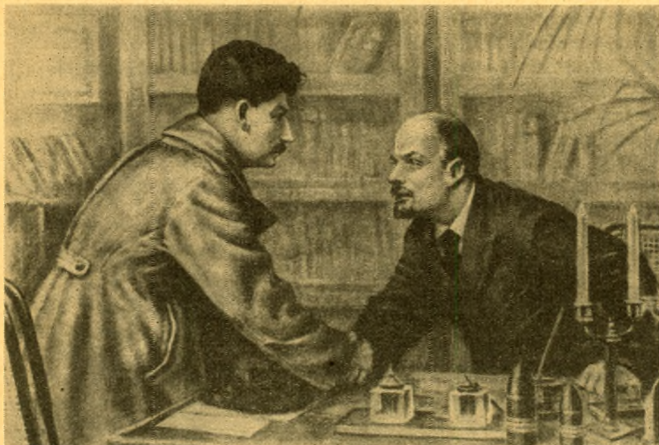
Petrogradi rindele minekul jätab Stalin Leninit hüvasti. Kunstnik Kazimierz Wójtyła pilt.

„Põhimõtteline poliitika on ainuõige poliitika“ — see on just see vormel, mille abil Lenin tormijooksul võitis uued „vallutamatud“ positsioonid, võites revolutsioonilisele marksismile proletariaadi parimad elemendid.