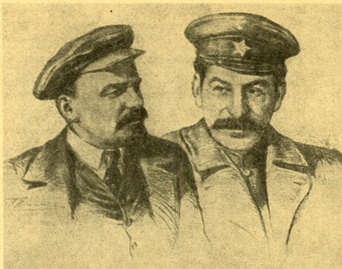
Lenin ja Stalin.

Järgmisel kongressil aastal 1907 Londonis osutusid bolševikud võitjaks. Ma nägin nüüd Leninit esmakordselt võitja osas. Tavaliselt ajab võit mõnedel juhtidel pea segi, teeb nad upsakaiks ja hooplejaks. Kõige sage-damini hakatakse selliseil juhtumeil võitu pühitsema, loorbereil puhkama. Kuid Lenin ei sarnelnud põrmugi sellistele juhtidele. Vastupidi, just pärast