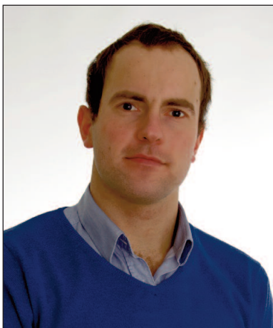
Ayrton Grossmann Telema AS tootejuht

Alles see oli, kui hakati massiliselt kasutama PDF-arveid ja enam ei pidanud igal hommikul pungil postkasti tühjendama. Arvete füüsilise edastamine sai lahenduse PDF-faili kujul. Arveandmete topelt sisestamine majandustarkvarasse nii saatja kui vastuvõtja poolt aga säilis. Aeganõudva andmesisestuse probleemi kõrvaldab e-arve.