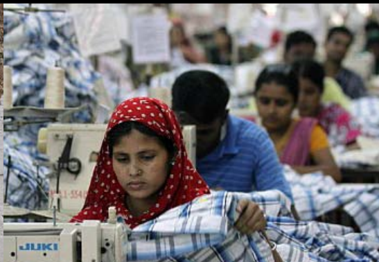
Bangladeshi riidetööstuses 14 kuud miinimumpalgal töötamist