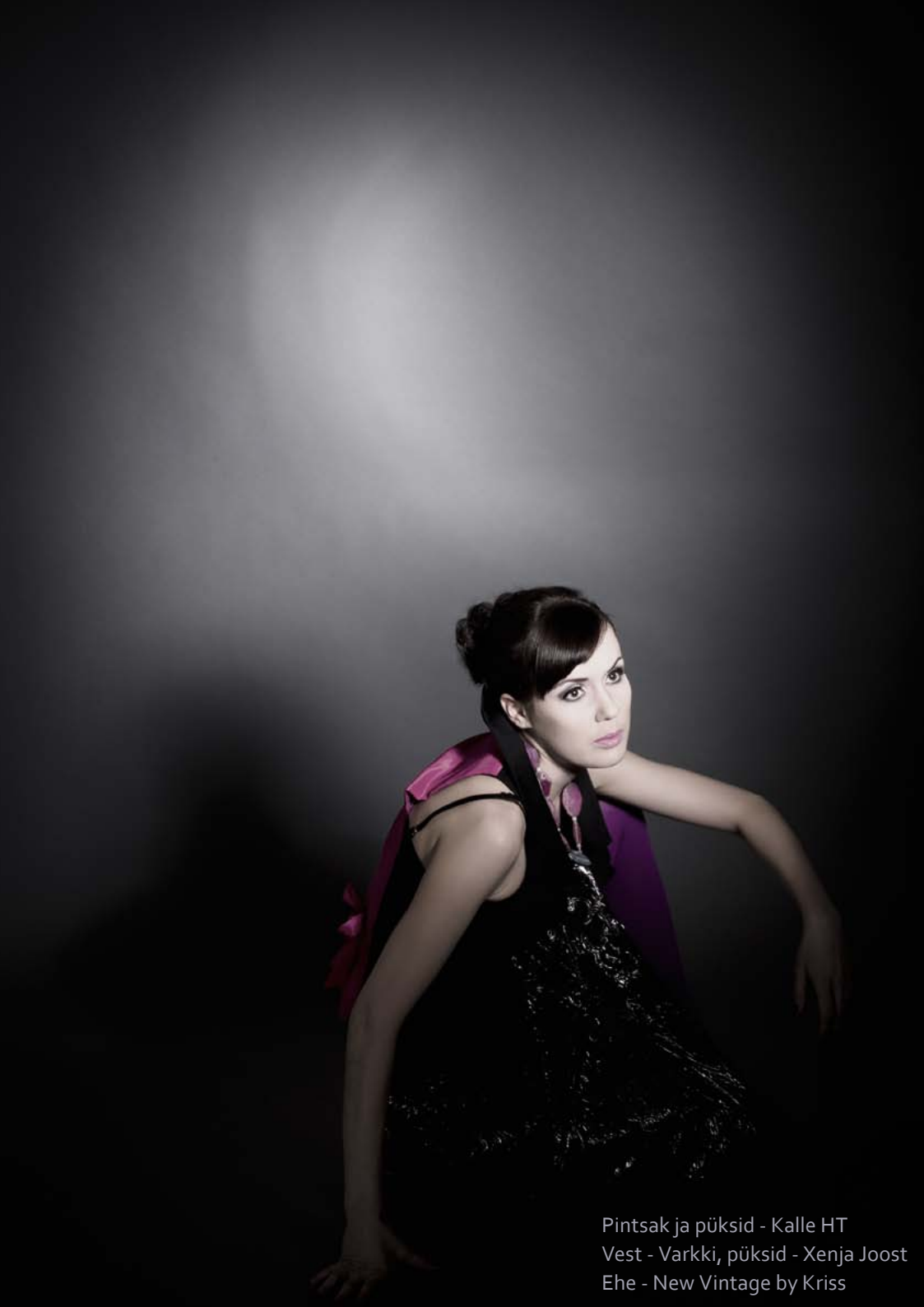
Pintsak ja püksid - Kalle HT Vest - Varkki, püksid - Xenja Joost Ehe - New Vintage by Kriss