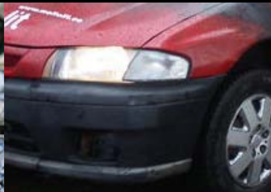
1996 Mazda 323