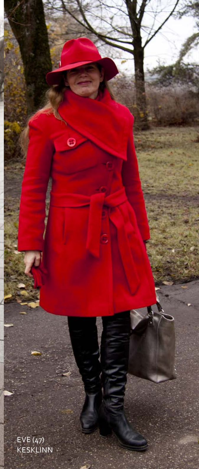
EVE (47) KESKLINN