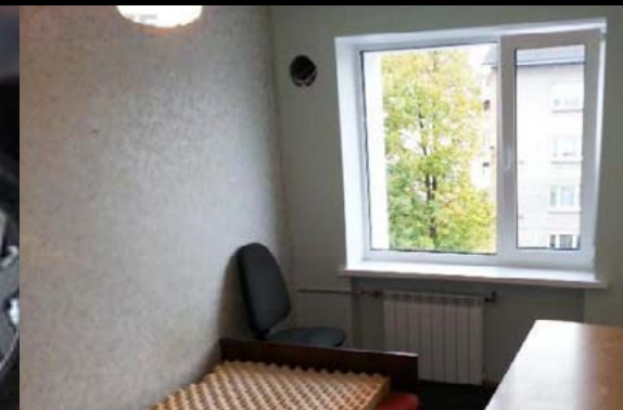
3toalise korteri üür Tartus