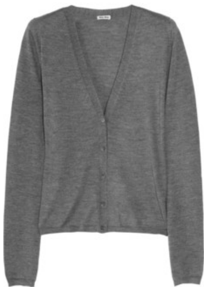
Hall kardigan - Miu Miu