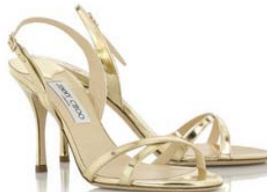
Jimmy Choo rihmikud