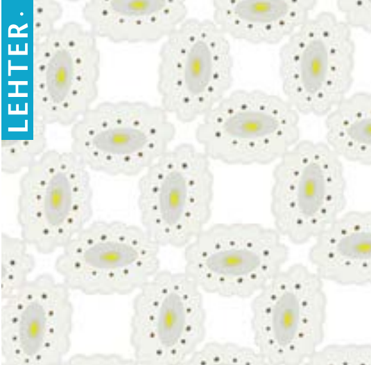
Illustratsioonid: Piia Harris-Põdersalu