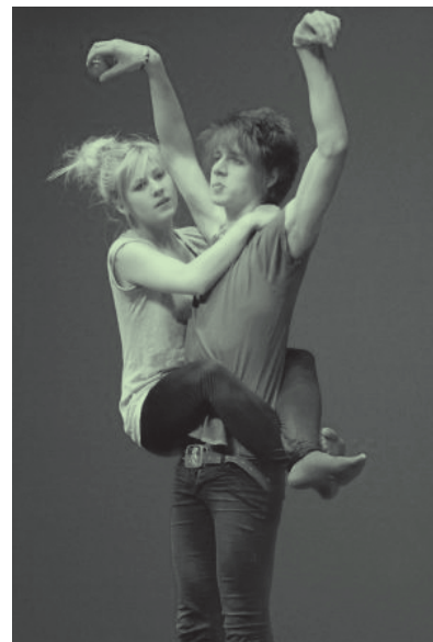
Koolitants 2011 finaali

Koolitantsul käib 18. aasta. Taasiseseisvunud Eesti kontekstis üsna aukartustäratav number, ka tegijate endi jaoks.