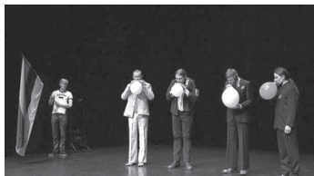
Made in Estonia maraton 2012 Õhtu täis ideid Info: www.saal.ee/event/453