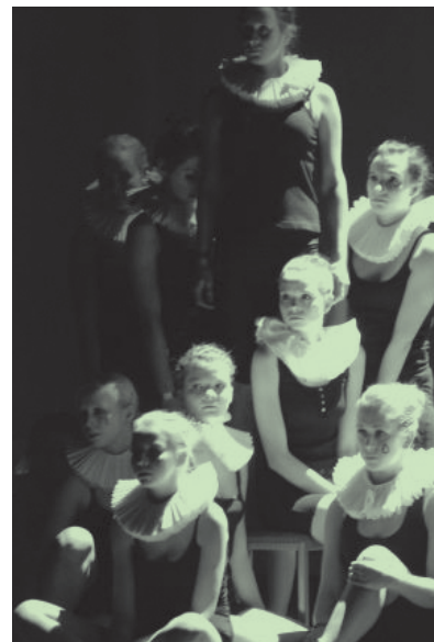
Koolitants 2011 finaali