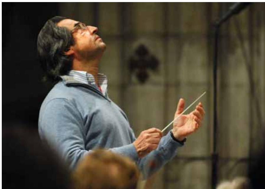
Riccardo Mutit tunnustati Birgit Nilssoni preemiaga.