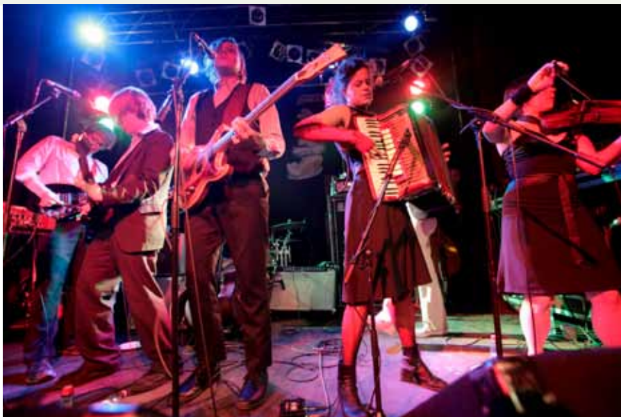
Üks "levi" ja "süva" sünteesijatest, kanada alternatiivrocki bänd Arcade Fire.