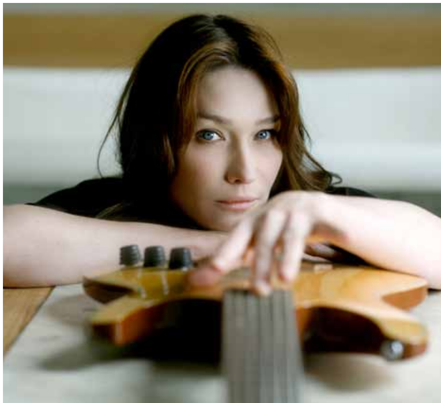
Carla Bruni – presidendiproua, supermodell, laulja, aktivist.

Endine supermodell ning laulja, Prantsuse presidendi Nicolas Sarkozy abikaasa Carla