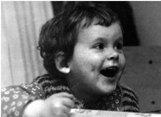
1979. aastal köögilaua ääres.