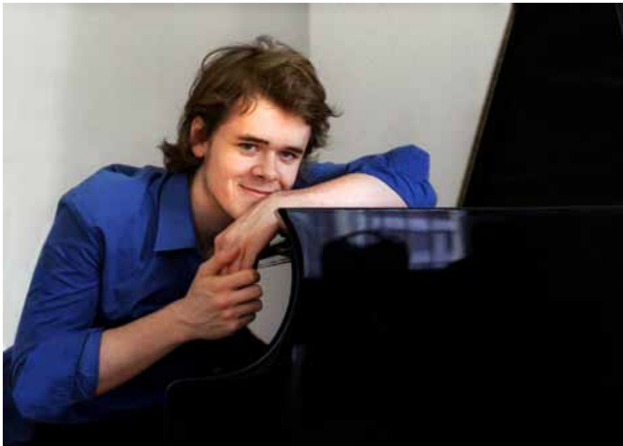
Noor briti talent Benjamin Grosvenor.

vust ja talenti oli näha viimati Jevgeni Kissinil. Grosvenori debüütplaadil kõlavad Chopini neli skertsot, Raveli "Gaspard de la Nuit" ning Chopini ja Liszti väikevormid.