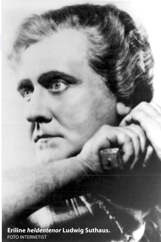
Eriline heldentenor Ludwig Suthaus.

Ludwig Suthausi natsiaegseid salvestusi on väga vähe. Üksikud aariad või stseenid