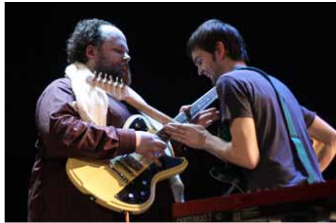
Porthos ja D'Artagnan.

Mind on alati võlunud su laulude vastuolu: parimad neist ajavad naerma ja kõlavad samas väga lüüriliselt ja kaunilt. Neid iseloomustab ilus meloodia, millelt justkui ei ootakski saatets sellises stiilis sõnastusi, musta huumorit näiteks. Kui teadlikult oled sa seda vastuolu, et naer ja heldimus ei pruugi teineteist välistada, ajanud?