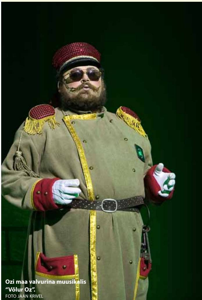
Ozi maa valvurina muusikalis "Võlur Oz".