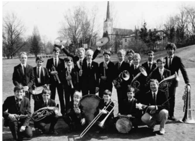
Noorte puhkpilliorkester. Väike tromboonimängija.