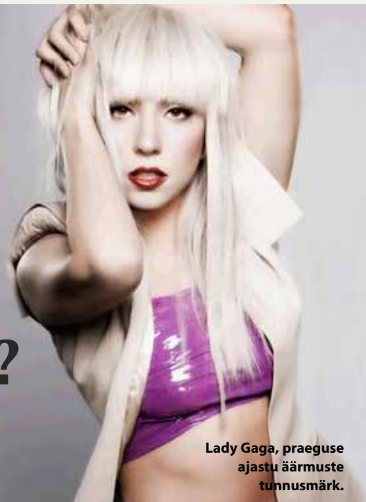
Lady Gaga, praeguse ajastu äärmuste tunnusmärk.

Pärnu Sütevaka Humanitaargümnaasiumi õpilane