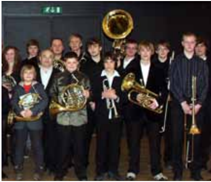
Kogu trompetivägi!