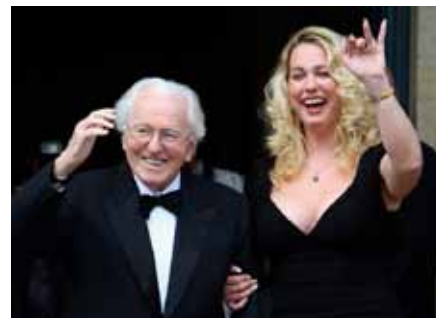
Lahkunud patriarh Wolfgang Wagner traditsioonide jätkaja tütar Katharina.

Ernst von Siemensi Muusikafond premeeris saksa dirigenti Michael Gielenit 200 000 euro suuruse auhinnaga. Tegemist on maineka rahvusvahelise muusikaauhinna, mille puhul tõmmatakse tihti paralleelne Nobeli auhinnaga. Preemia on suuna-