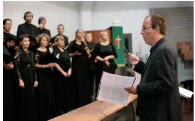
Töötamas Eesti Filharmoonia Kammerkooriga.

Ma teadsin, et see saab olema kõige selle kõrval, mida ma juba naganii tegin, raske, kuid olin juba tajunud koori vaimu, mis oli