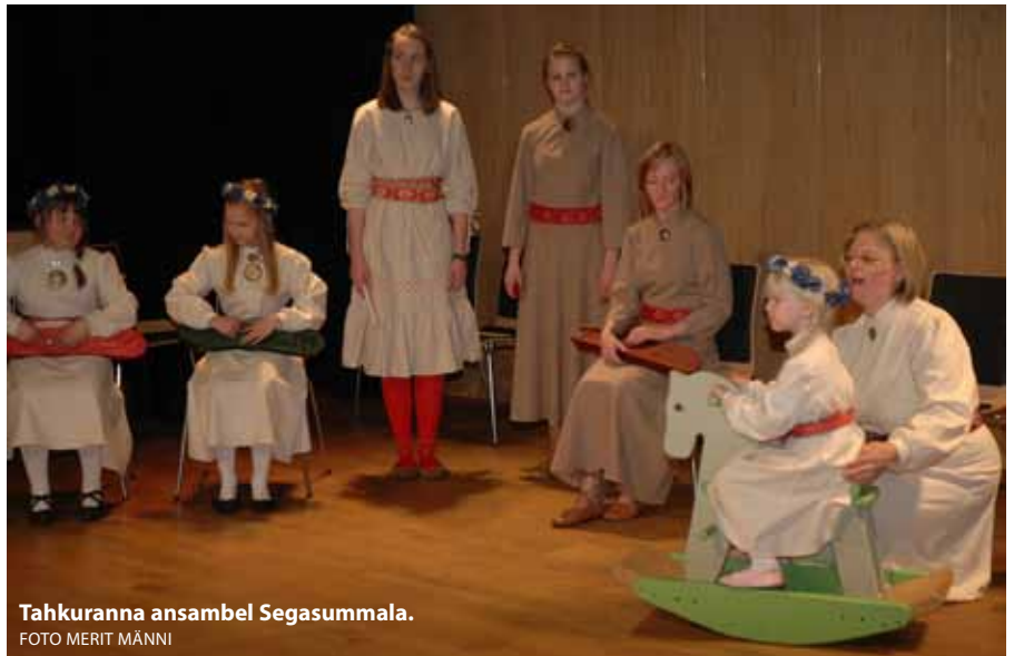
Tahkuranna ansambel Segasummala.