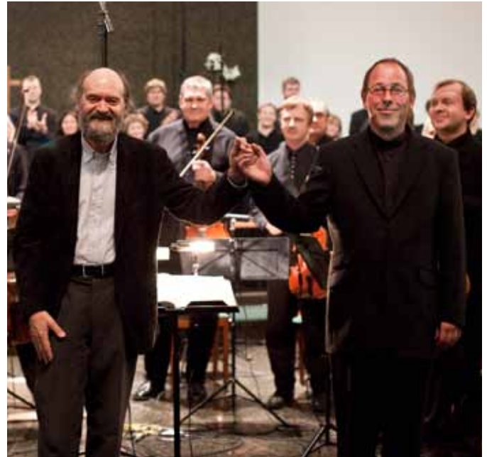
Arvo Pärdi Tallinna Metodisti kirikus 3. oktoobril 2009 pärast Pärdi "Berliini missa" ettekannet.

Olge rahulikud, teile endile sobib see ju suurepäraselt! Muidugi on seda keelt raske õppida ja rääkida. Olen täiesti aus öeldes, et mulle tundub, et eesti keel sobib enim väikevormide jaoks. Mul võttis