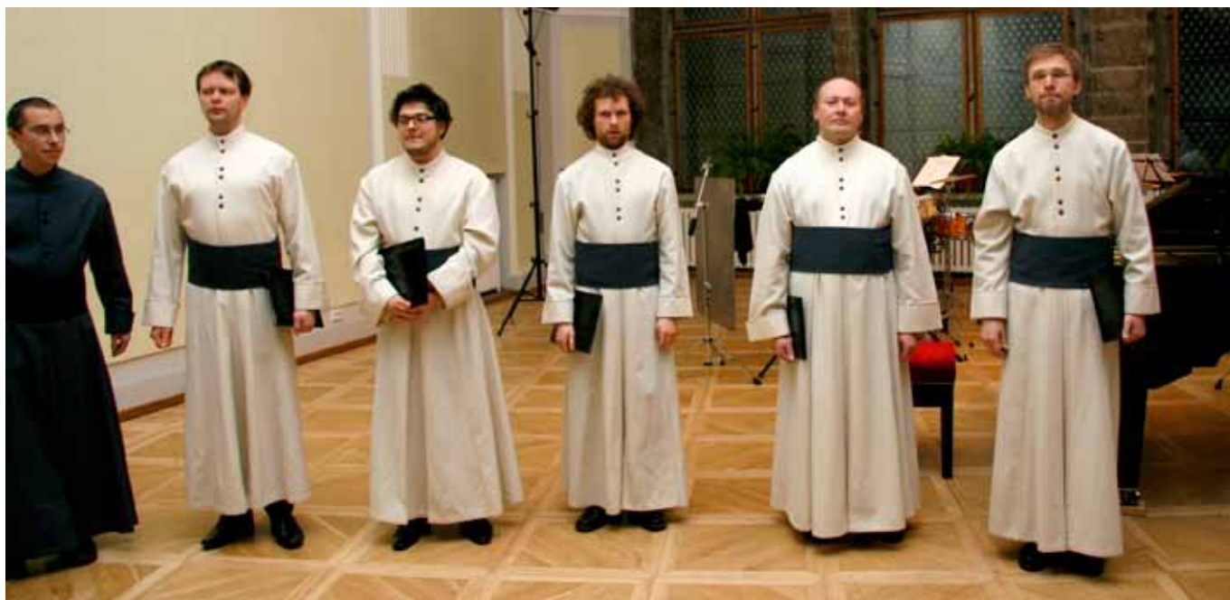
Imetlusväärsele hea esinemiskindlusega ansambel Vox Clamantis end välja pakkumas Eesti muusika päevade ja Tallinn Music Weeki ühisel showcase-kontserdil.