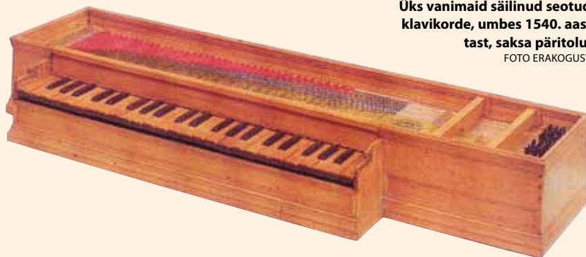
Üks vanimaid säilinud seotud klavikorde, umbes 1540. aastast, saksa päritolu.