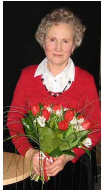
Ada Kuuseoks pärast kontserti.