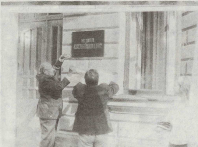
◆ 1991 aasta sügisel sai kultuurikool kolledžiks

Rakenduslik kõrgkool on Eestis uus mõiste ning seoses sellega on mitmeid lahtisi otsi. Loodame, et lähitulevikus võtab parlament vastu sellealase seaduse, mis fikseerib meie koha Eesti kultuuripildis.“