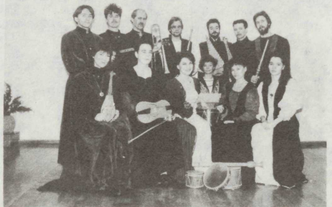
◆ Viljandi Linnakapell

K: Arvame, et see „midagi“ mängib suurt rolli. Vaieldamatult on 99% ikkagi suur töö, kuid ilma selle puuduva üheta ei tule täiuslikku tunnetust.