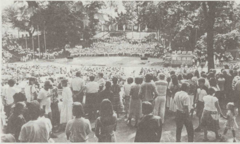
◆ Viljandi Maakonna Laulupäev 7. juunil