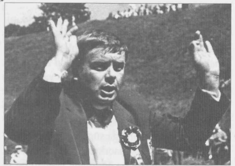
Laulupäeval Paides 1993