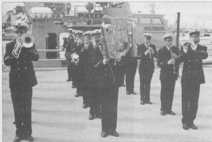
PIIRIVALVE ORKESTRI KONSERT PIRITAL 22 MAI

EST-TATTOO '99 programm oli tihe. Külalised saabusid 19. mail. 20. sõitsid kõik orkestrid erinevatesse