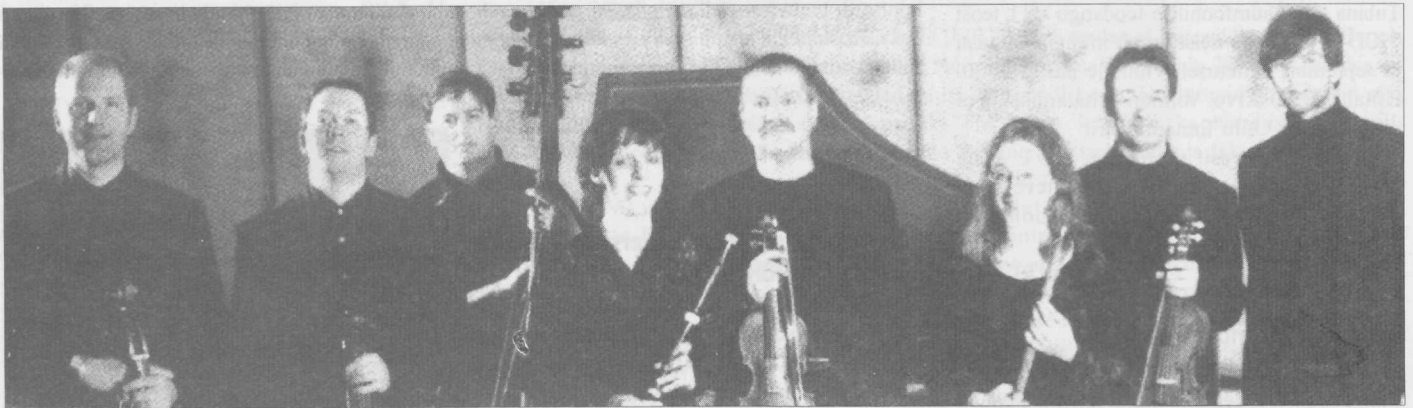
MUSICA ANTIQUA KÖLN (Saksamaa) Ansambli juht REINHARD GOEBEL

Ansambli Musica Antiqua Köln kontseri kogunes kuulama tavatult palju tavatut publikut: diplomaate, poliitika- ja äritegelasi. Põnev oleks teada, mil moel toodi neid kuulama elitaarset, vana ja vähe tuntud muusikat peaaegu et teaduslikult interpreteerivat ansambli, kui hoopis demokraatlikumad kontserdid lähevad pahatihti poolikule auditooriumile?