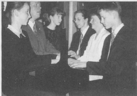
Isa tütardega ja ema poegadega esmakordselt esinemas