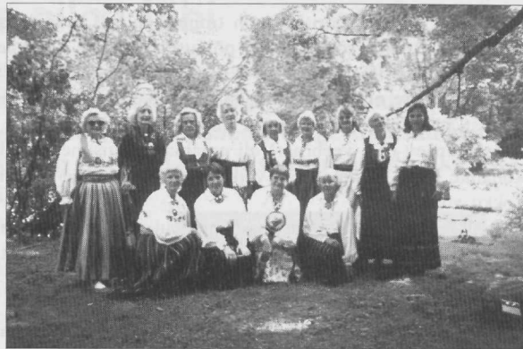
Osa naiskoori liikmeid Skandinaavia festivalil 1998