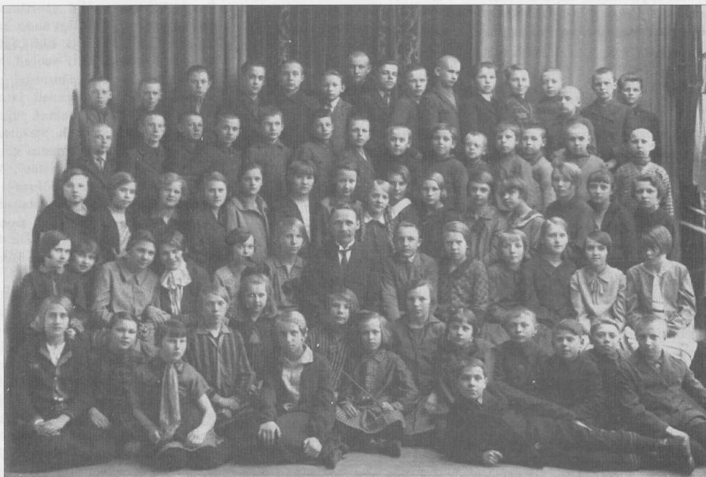
Wanemuise lapsed koos koorijuhhi Johannes Ernesaksaga 1927.a.