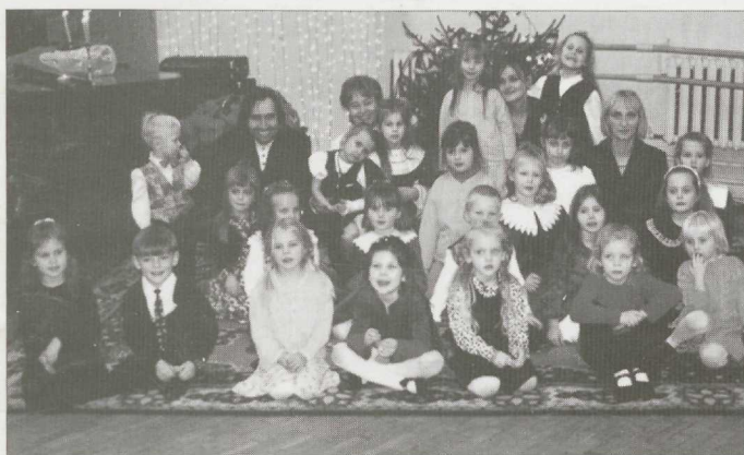
Lasteekraani Muusikastudio kõige noorem rühm (Jõulud 1998). Taga vasakul autor.

XXIII Üldlaulupidu 1.- 4. juulil 1999 on mitmeti ajalooline ja samas uuenduslik. Käesoleva artikli autorile annavad eriti põhjust rõõmustamiseks eesti noorimad koorilauljad – mudilaskoorid 7-11 aastaste lauljatega. Esmakordselt on üldlaulupeol see kooriliik esindatud ja seda täiesti õigustatult – varasemad noorte laulupeod on näidanud, et tänu headele õpetajatele ja värskete vaimule on mudilased suutnud pakkuda Lauluväljakul mitte ainult silmarõõmu, vaid ka eakohast tõsiseltvõetavat muusikalist clamust.