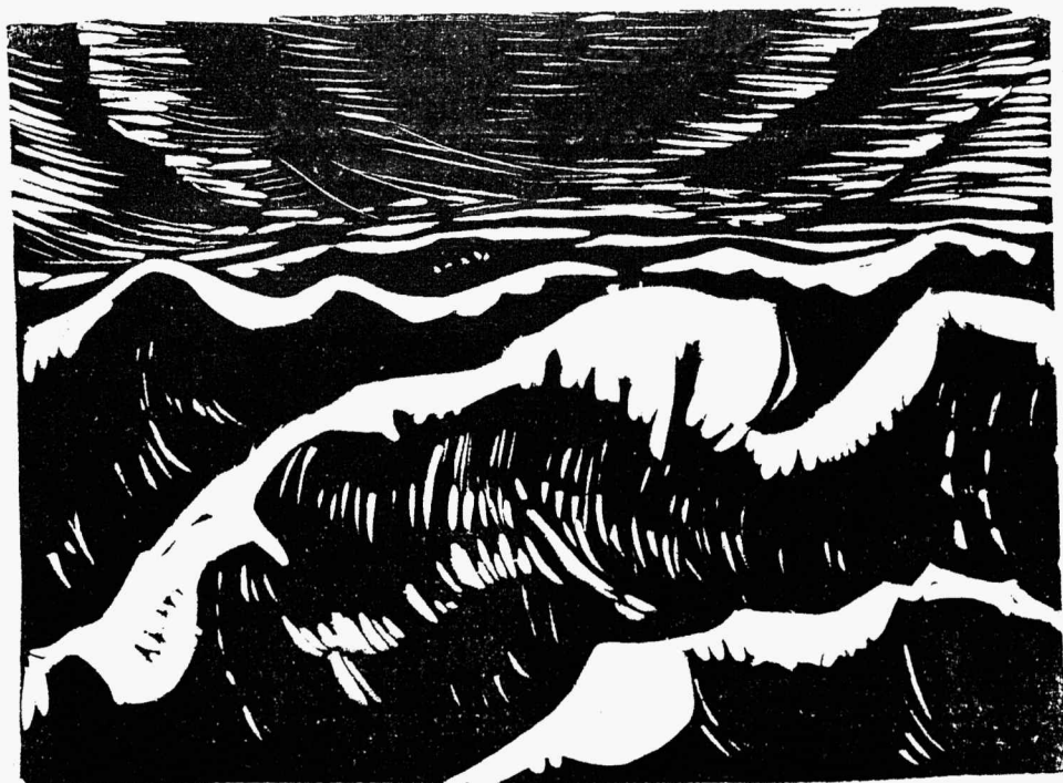
OLEVI MIKIVER: TSUKLIST „MERI“