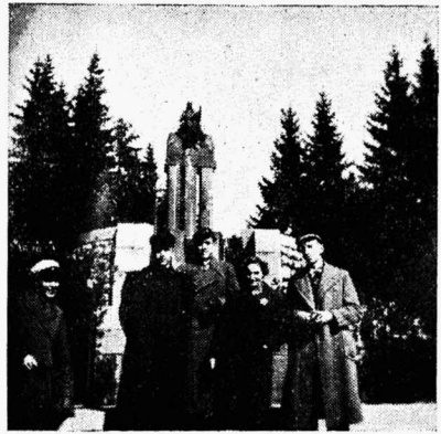
Meie mehi Soomes

posantsemaid ehitisi on siiski eduskunnaahoone, mis esitab väärikalt Soome kunsti ja rikkust. Selles esinduslikus majas korraldas Soome Hariduseminister meile suur-