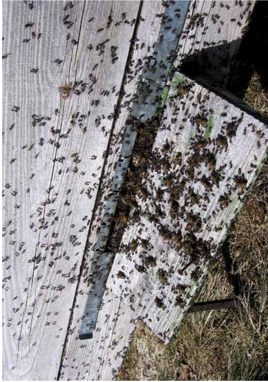
3. Sipelgate rünnak. Mesilased ei osutanud suuremat vastupanu, vaid otsustasid lahkuda (13. aprill 2011).