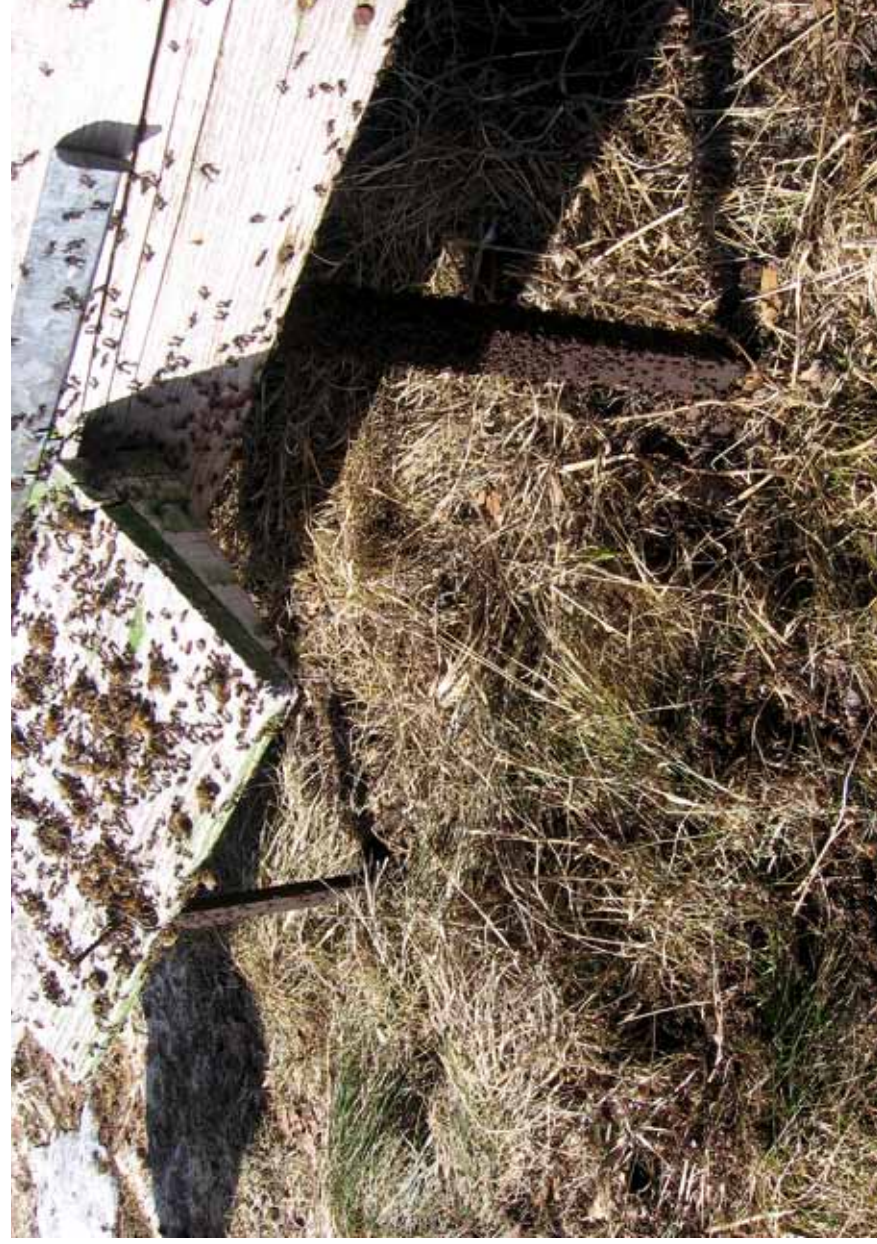
2. Sipelgate rünnaku tulemusel hävisid kõik kaheksa peret, mesilased lendasid laiali (13. aprill 2011).