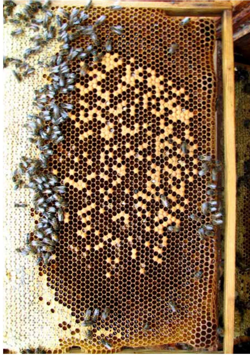
4. Aeglane kollaps varroatoosi läbi. Vähene hulk allesjäänud mesilasi ei suuda hauet katta (7. september 2009).