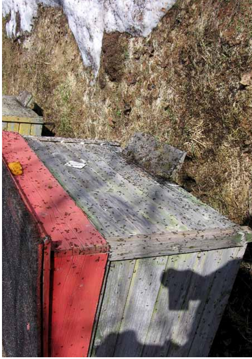
1. Sipelgad ründavad korraga mesila kõiki kaheksat mesilasperet (13. aprill 2011).