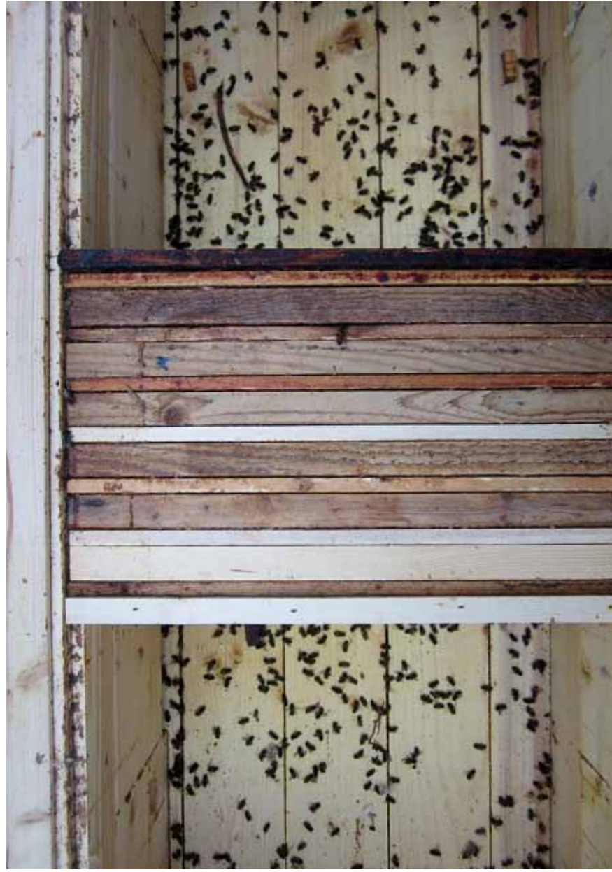
6. Mesilaspere sügisene hukkumine on alanud mesilaste laialirionimisega. See on ebatavaline käitumine, sest sügisel koondub pere, vastupidi, talvekobarana kokku (25. november 2011).