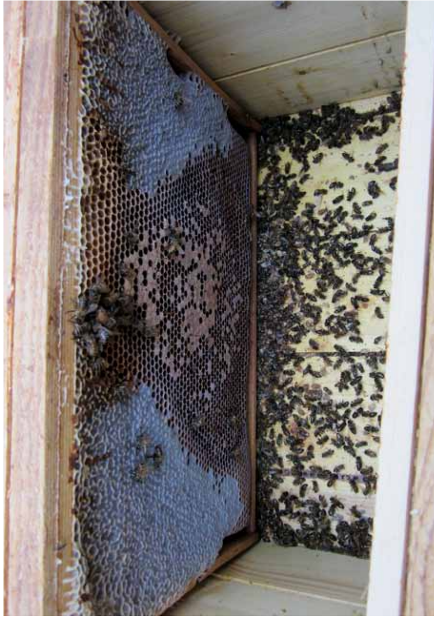
7. Mesilaspere hukkumine talve algul viirusepideemia läbi. Tarus on rohkem surnud mesilasi, kuna paljud suurema hakanud mesilased ei lennanud külmade ilmadega välja, nagu nad tavaliselt teevad (4. detsember 2011).