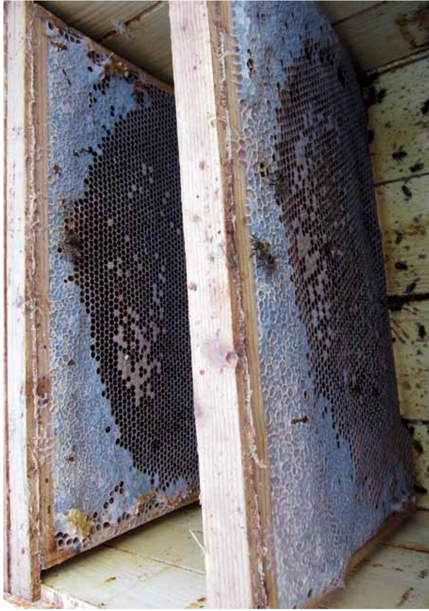
5. Varroatoosi vallandatud tugeva, üheksat raami katnud pere kollaps. Mesilased lendasid laiali, tarru jäi vähene haue ja väga väike hulk mesilasi koos emaga, kes samuti hukkusid (20. november 2011).