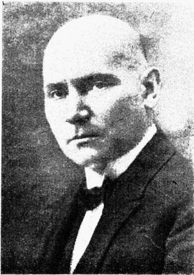
Kirjanik Oskar Luts.

lugeda ja iseäranis noortel muidugi, sest nendes on kõik, mis tal olnud ja mis olemas.