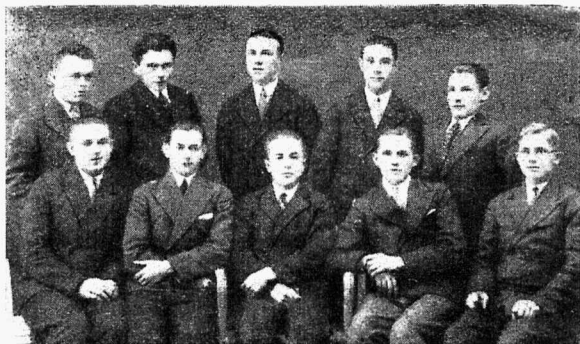
Maleturniirist osavõitjad :