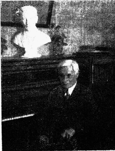
Helilooja A. Läte oma töökabinetis.

Ilusal aprillikuu hommikul arvasime heaks külastada meie lugupeetud heliloojat A. Läte't. Sammusime Tähe tänavat mööda kuni majani, kus elab tuntud helilooja. Avades maja paraadukse ja sammudes üles trepist jõudsimise ukseni, millel seisis kirjutatud nimekaart — A. Läte. Arvasimegi, et seisame lugup. helilooja lihtsal ukسلävel. Koputasime uksele ja varsti avati too ühe lahke proua poolt. Küsisime: „Kas elab siin helilooja A. Läte ja kas võib teda külastada?“ Jaatavat vastust saades astusime tuppa, kust juhiti meid edasi teise ruumi, kus kohtusime heliloojaga. Teretades ja surudes lahke vanahärra kätt juhüb ta meid oma kabinetis.