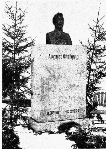
A. Kitzbergi hauasammas.

Usk on üldse müsteerium, mis sageli annab inimesele uut jõudu, tahet ja lootust edasijõudmiseks tähtede poole. Usk on leib. Ning kas saab tänapäeva noorugi sellela läbi? Ta farvotab küll igasuguseid aseaineid, kuid küll kord leiab femagi organism selle puuduva.