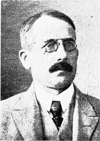
Luuletaja Gustav Suits.

Suits vastab: „Too aeg oli täis romantikat, oli enam romantiline aeg, oli unistada milleski paremast. Praegune aeg on aga väga praktiline ja realne. Noored aga ihkavad, armastavad romantikat. Tol ajal ei olnud emakeelset kooli, polnud rahval oma riiki. Tuli võidelda, et saaks kooli emakeele tunde, tuli