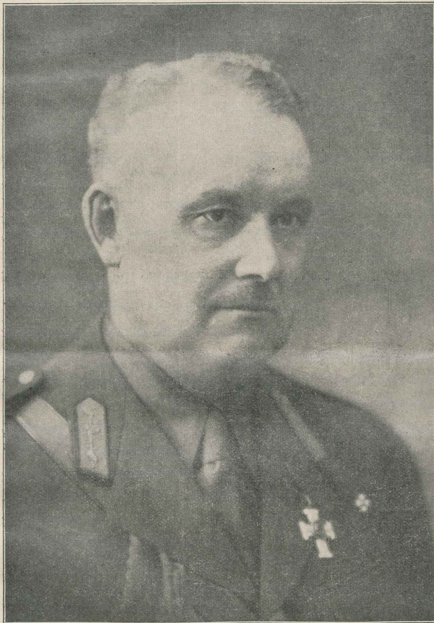
Sõjavägede Ülemjuhataja kindralleitnant J. Laidoner.