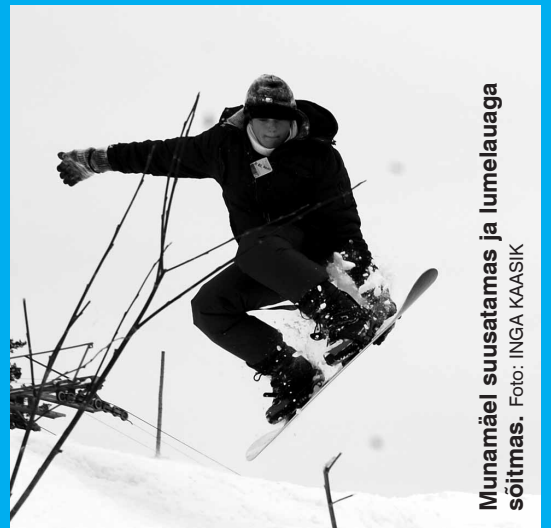
Munamäel suusatamas ja lumelauaga sõitmas.