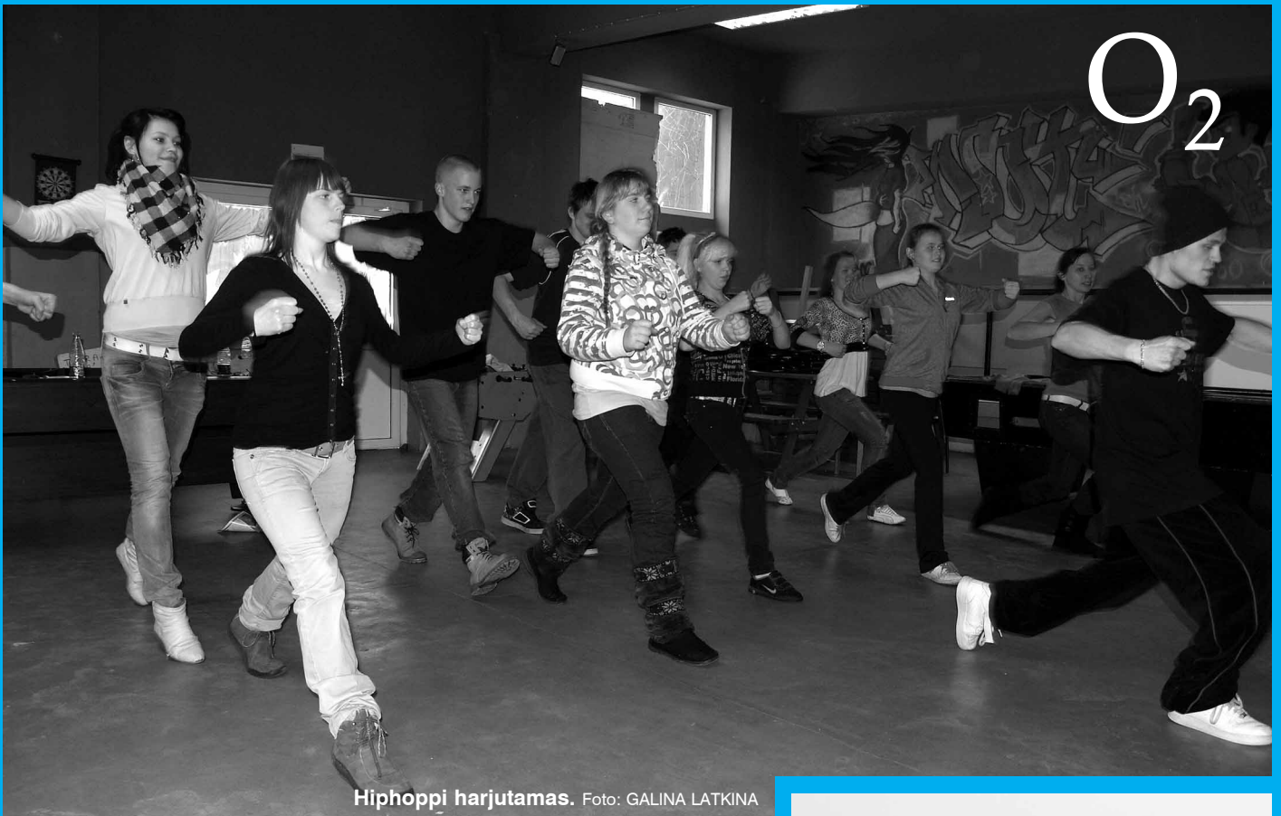
Hiphoppi harjutamas.