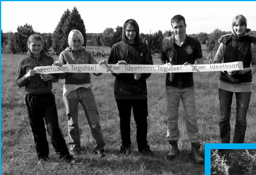
Üks värvikuulimängu võistkond.