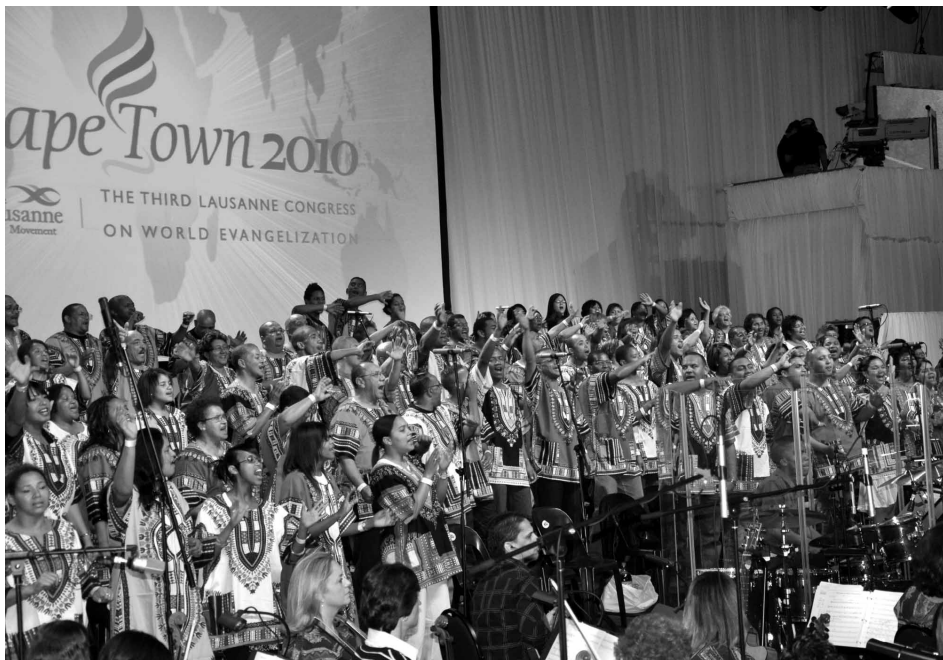
Avamise öhtul esinenud laulukoor.

Järgnes kohalike evangeelsete alliansside koostöö denominatsioonidega, et esindatud saaksid nii erinevad denominatsioonid, vanemad kui ka nooremad juhid, mehed kui