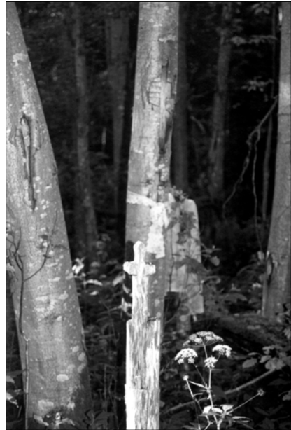
Foto 5. Il loša endisel kabeli-kohal puudele lõigatud ristimärgid. Foto E.-H. Västrik 1998.

se – erisus tuleb kujukalt välja ka üldisest süžeeskeemist kõrvalekalduvas teisendis (näide 1), milles karjus näeb ja lööb piitsaga puu otsas olevat ikooni. Sellel juhul on imelise sündmuse kinnituseks hiljem puu otsast leitud pühapilt (h2), Jumala kõndimine maa peal ning astumine kivile on aga esitatud sissejuhatavas episoodis. Ning ka väljaarendatud teisendites (näited 3, 4, 5), milles mainitud imelised sündmused on üksteisega sujuvalt seotud, on selline imelise “kordumine” süžeeoloogika seisukohalt liiane. Dubleerimine tuleb kõige kujukamalt välja teisendis (näide 3), kus on ühendatud nii karjuse piitsa puusse kinnijäämine, kivile jälgede vormimine kui ka allika tekkimine (h2).