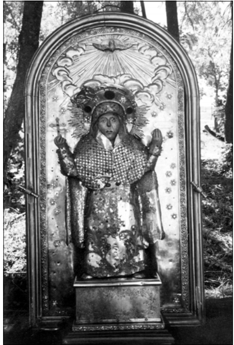
Foto 2. Püha Paraskeva imettegev ikoon. Foto oli müügil Il'loša kirikus 2000. a.

le, kõrvalaltarid aga prohvet Eeliale ning suurkannataja Püha Paraskevale. Just viimatinimetatud pühaku ja tema imettegeva ikooniga (vt foto 2), mida kirikus hoiti, on tihedalt seotud ka Il'loša kabelikohaga haakuv kultus ja rahvapärimus.