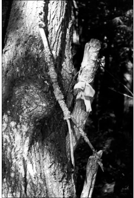
Foto 4. Riideribad puudel, mis kasvavad Il'loša endise kabelikoha lähedal. Foto E.-H. Västriku 1998.