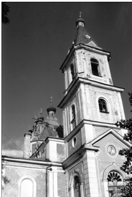
Foto 1. Il'loša kirik 1998. aastal.