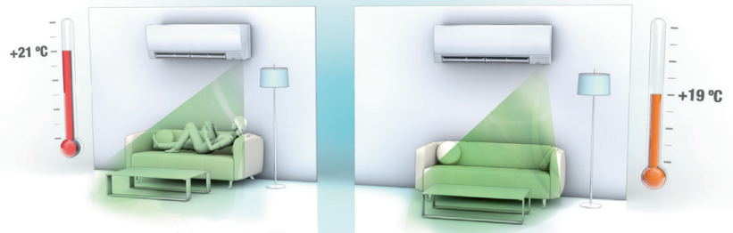
Inimese kohalolu tunnetav sensor vähendab küttekulusid