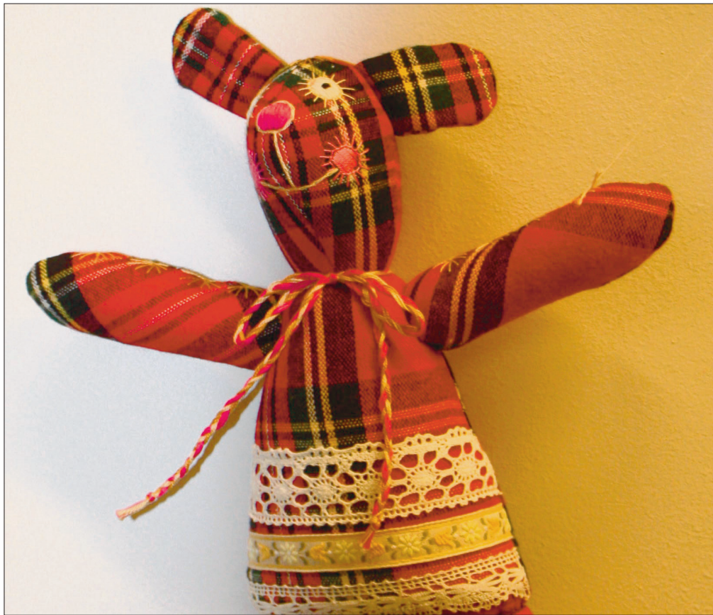
... teisel hoopiski pitsitükid.