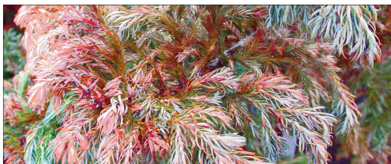
8. Mägi-ebaküpress 'Boulevard'.

okkaid. Suuremad kuivanud oksad lõigake välja.