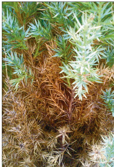
3. Hiina kadakas 'Stricta'.