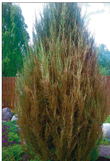
5. Kaljukadakas 'Blue Arrow'.

gub, kui paljud neist suudavad end taastada ja keda ootab lõke. Aegajalt katsuge käega, kas puu on nõus loovutama oma kolletunud