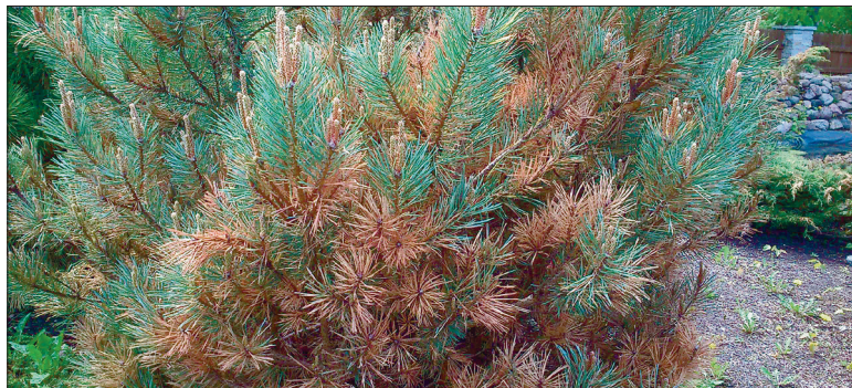
7. Harilik määnd 'Watereri'.