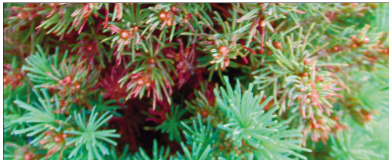
6. Kanada kuusk 'Conica'.

gub, kui paljud neist suudavad end taastada ja keda ootab lõke. Aegajalt katsuge käega, kas puu on nõus loovutama oma kolletunud