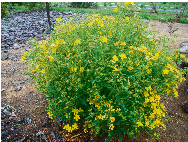
Oklahoma naistepuna on tihe püstine põõsas, mis õitseb juulist lumeni.

■ Põhja-Ameerikast pärit liik H. densiflorum sarnaneb eelmisega. Teda võiks katsetada ka Eestis, sest looduslik leviala on suhteliselt külmas piirkonnas. Saksamaal müüb üks puukool sorti 'Goldball'.