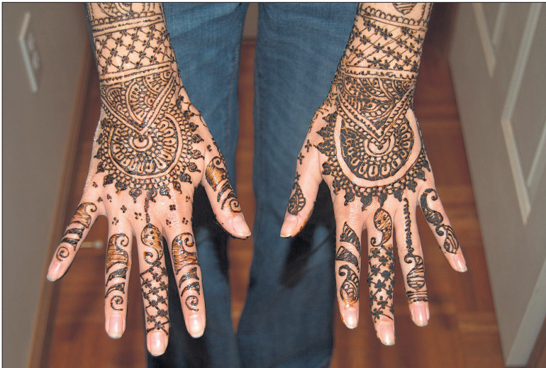
Hennatätoveering on ajutine, kuid pole nahale samuti ohutu.

ta hennaga tehtud tätoveering on põhjustanud tüsistusi.