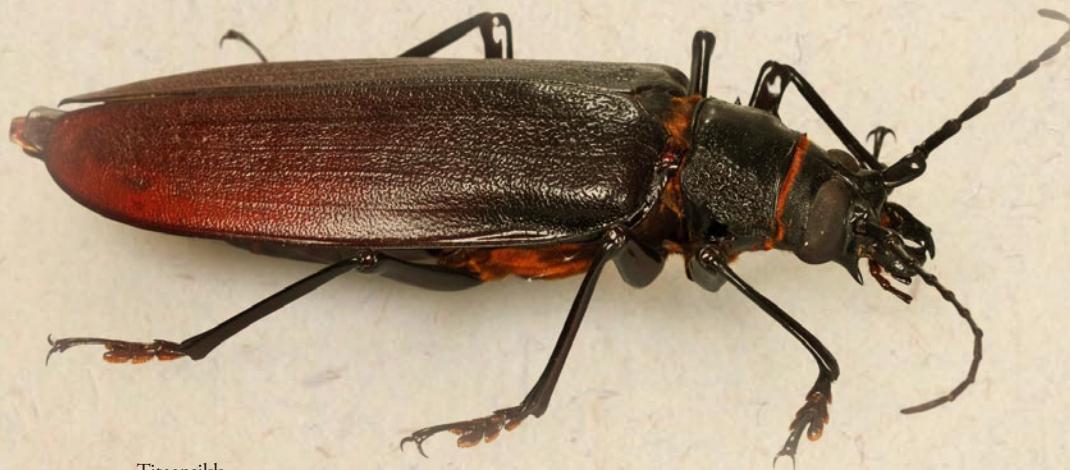
Titaansikk. Eksponaat Tartu Ülikooli loodusmuuseumi kogudes