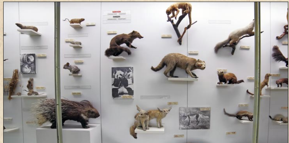
Zooloogia ekspositsioon vahetult enne remonti 2012. aastal

2012.–2013. aastal uuendab loodusmuuseum ekspositsiooni. 2013. aastal on muuseumisaalid suletud remondiks, haridustegevused toimuvad asendusruumides ja õuesõppena. Ekspositsioon avatakse taas 2014. aasta alguses. Uues ekspositsioonis Maa ja elu arengust leiavad koha lisaks traditsioonilistele geoloogia ja zooloogia teemadele ka uued valdkonnad, sealhulgas botaanika ja ökoloogia. Tänapäevase sisseade saavad muuseumi õppeklassid. Ekspositsiooni ja õpikeskkonna uuendamist kaasrahastab Euroopa Liidu Regionaalarengu Fond.