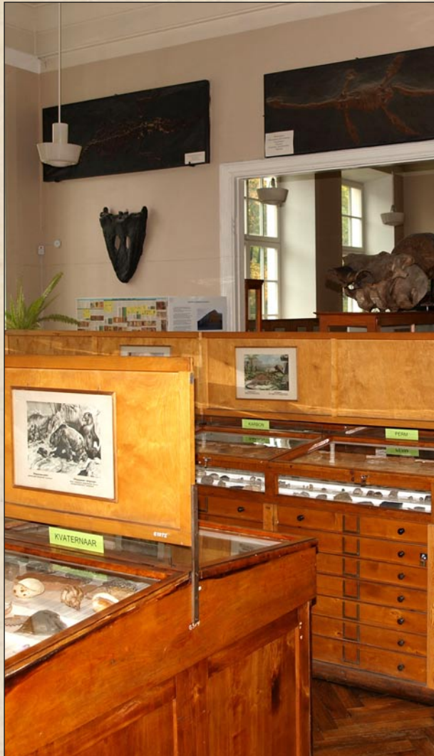
Geoloogia ekspositsioon 2012. aastal