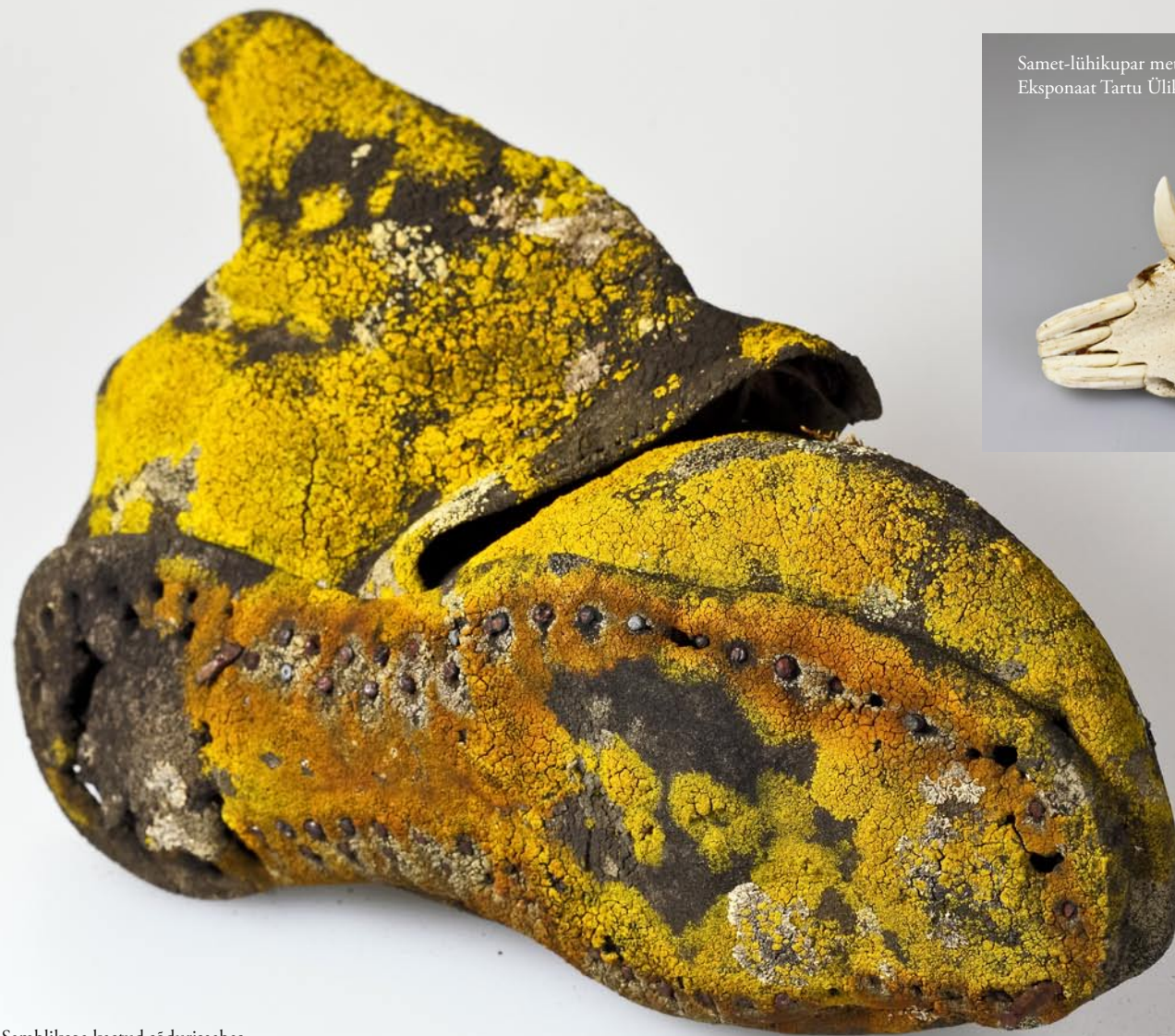
Samblikega kaetud sõdurisaabas. Eksponaat Tartu Ülikooli loodusemuuseumi kogudes