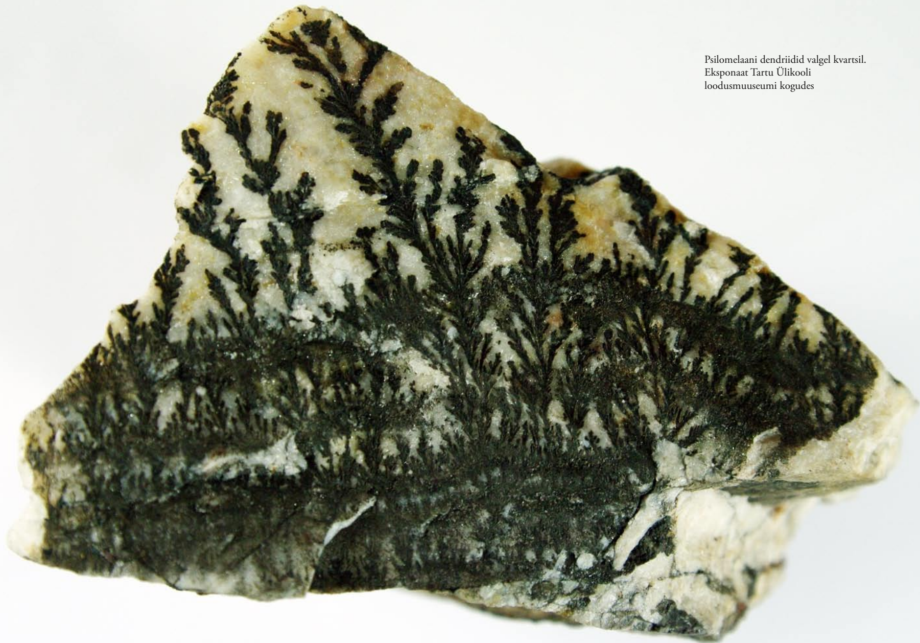
Psilomelaani dendriidid valgel kvartsil. Eksponaat Tartu Ülikooli loodusmuuseumi kogudes