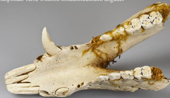
Samet-lühikupar metssea alalõualuul. Eksponaat Tartu Ülikooli loodusemuuseumi kogudes