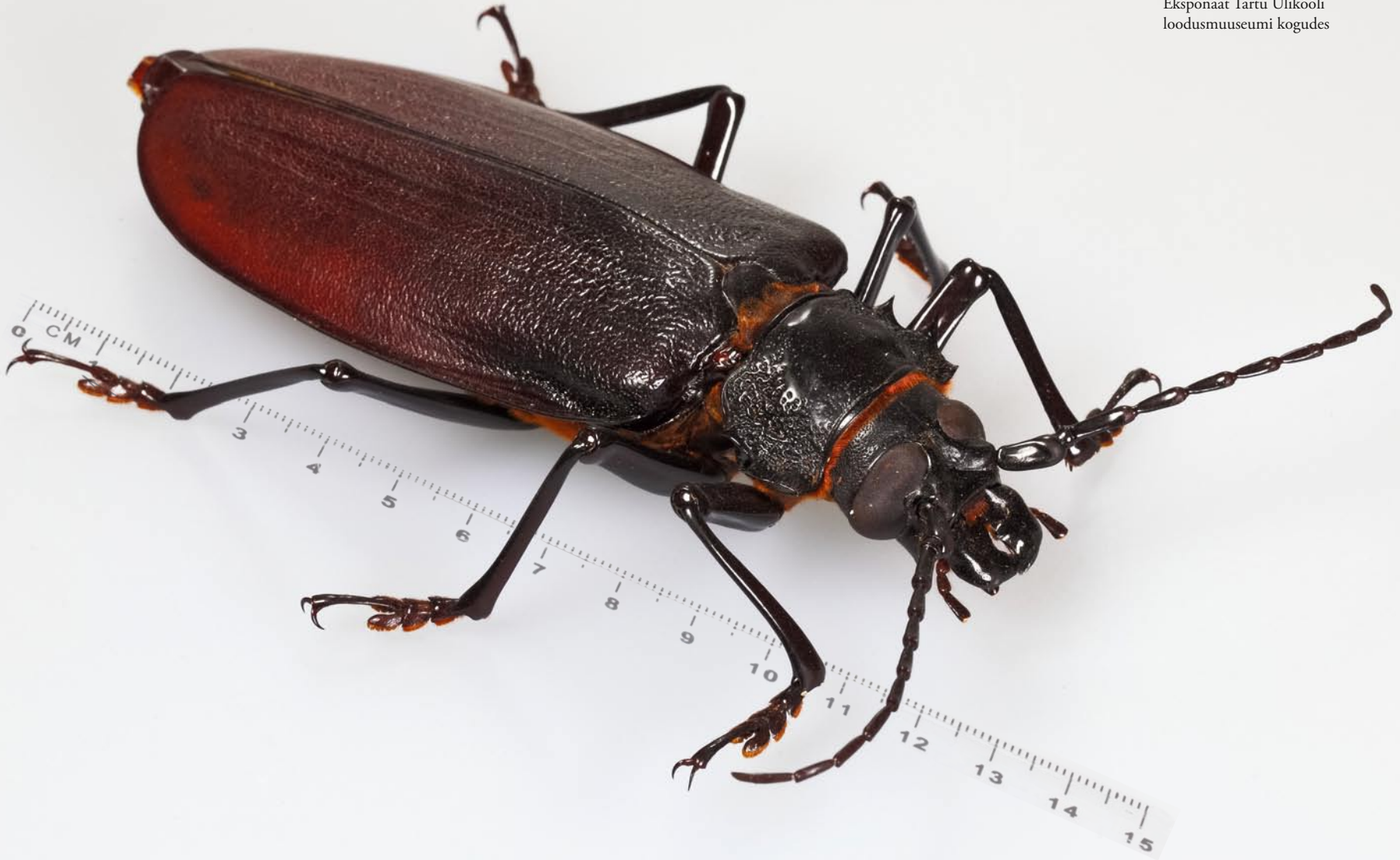
Titaansikk. Eksponaat Tartu Ülikooli loodusmuuseumi kogudes