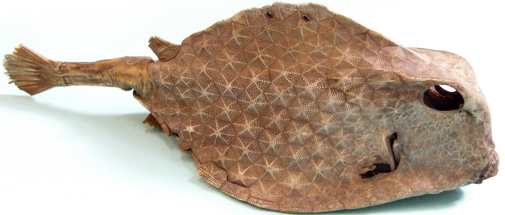
Kohverkala. Eksemplar Tartu Ülikooli loodusmuuseumi kogudes