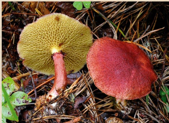
Seen Suillus asiaticus . Kuivatatud seene eksemplar on talletatud Tartu Ülikooli loodusmuuseumi fungariumis

Suure sirmiku mulaaž Tartu Ülikooli loodusmuuseumi kogudes