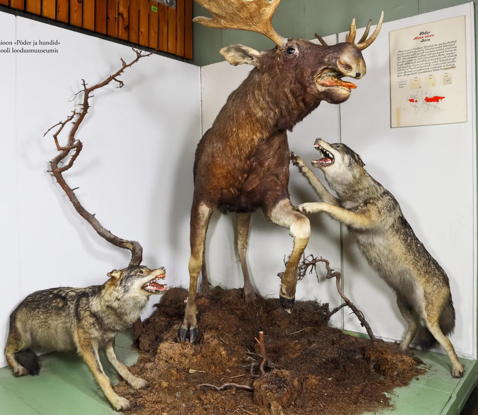
Kompositsioon «Pöder ja hundid» Tartu Ülikooli loodusmuuseumis