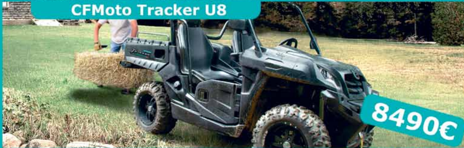
CFMoto Tracker U8