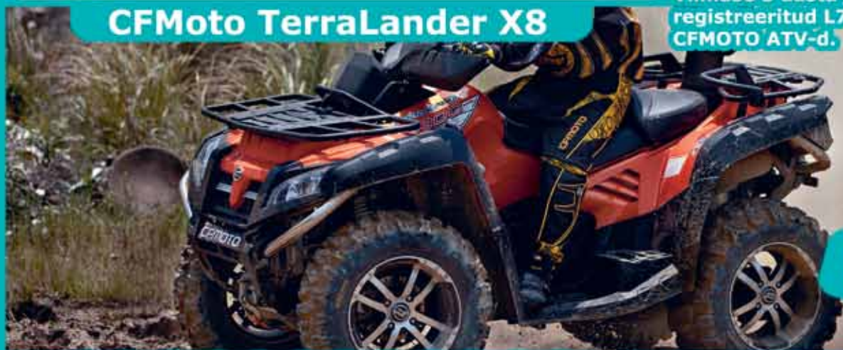
CFMoto TerraLander X8

Viimase 3 aasta jooksul on enim registreeritud L7e kat. sõiduk just CFMOTO ATV-d.