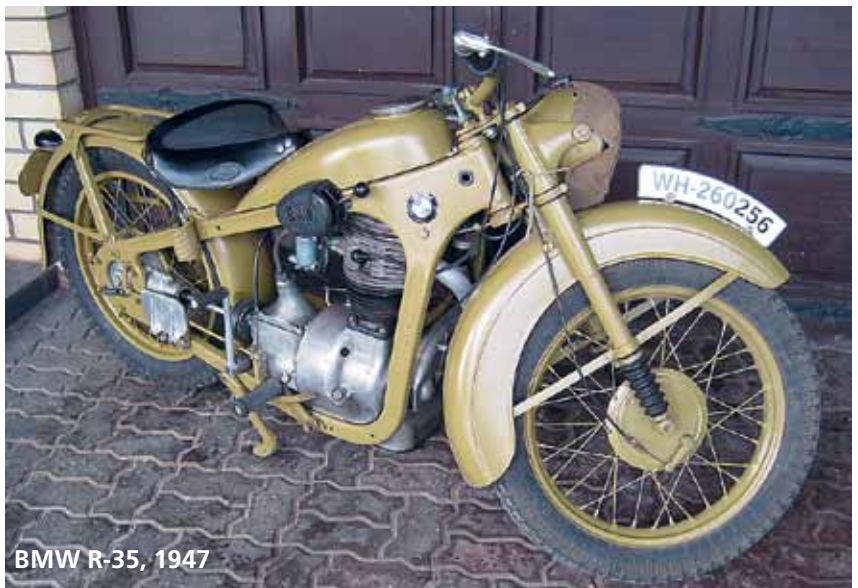
BMW R-35, 1947

mist väärt nõukogude aega jäänud võidusõidumootorrataste tootmine Vihuris. Kui vaadata mootorrataste arengut sajandi alguse esimese 50. aasta jooksul, on muutunud pea kõik. „20. sajandi alguse rattad meenutavad jalgratast bensiinipaagi ja mootoriga,” võtab kokku Vint. Kadri Tamm