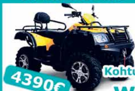
CFMoto 500 Basic