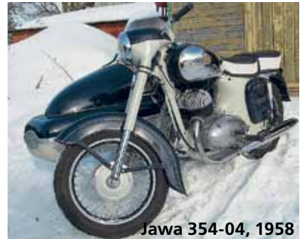
Jawa 354-04, 1958