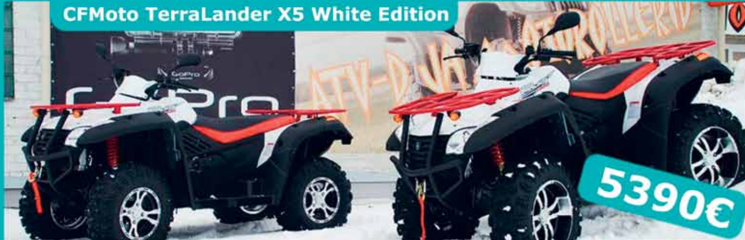
CFMoto TerraLander X5 White Edition