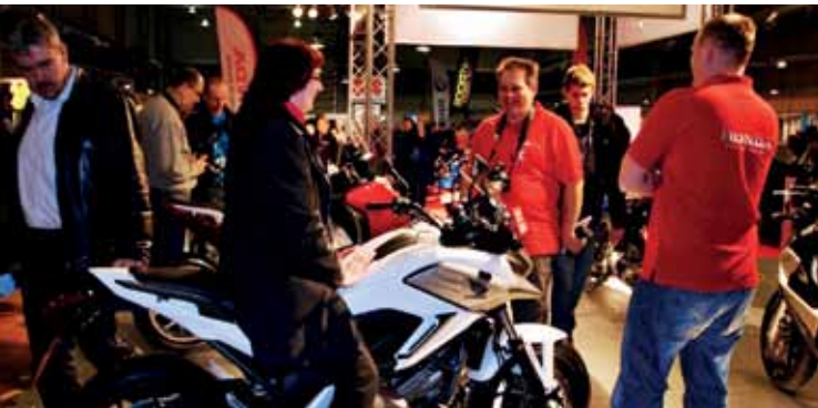
Fotod eelmise aasta messilt.