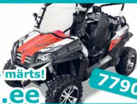
CFMoto TerraCross 625 EX