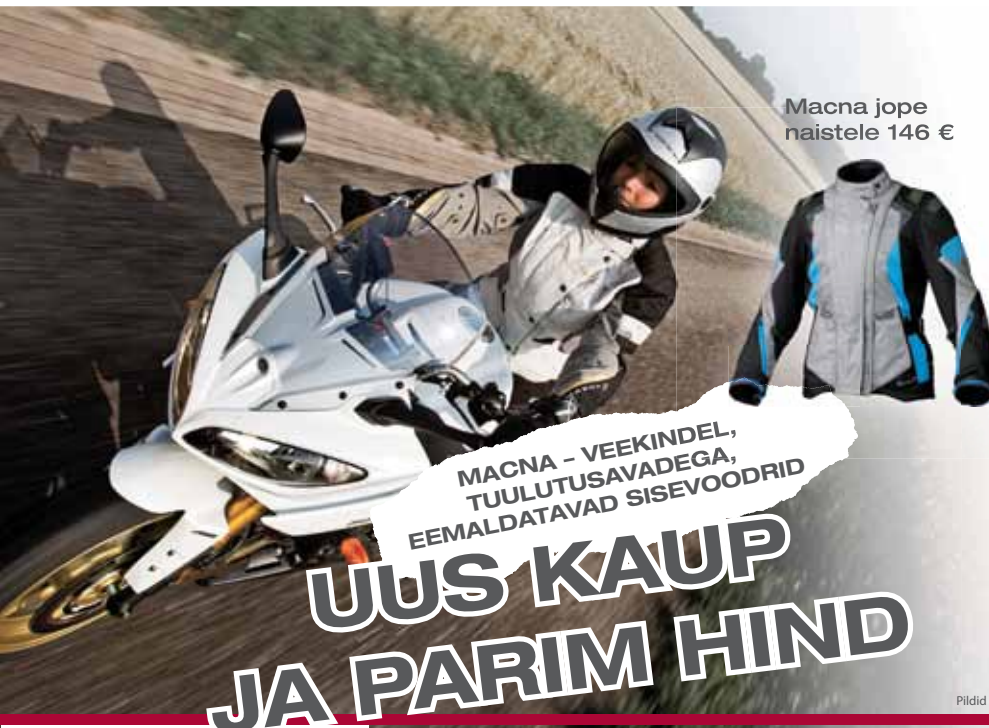
Macna jope naistele 146 €