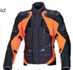
Macna jope meestele 142 €