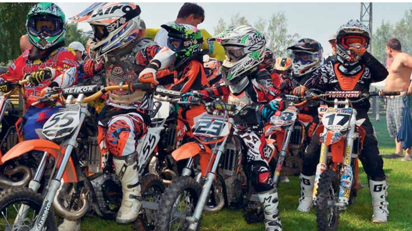
Mullune Läti meistrivõistluste etapp Stelpes: võistlustules on viie -kuni üheksaastased lapsed.

Motokross on atraktiivne spordiala, mis nõuab sõitjalt nii tugevat keha kui erksat vaimu, kasuks tuleb ka hea tehnika tundmine ning tsipake julgust. Enda proovile panemine ja müriseva tsikli raskel rajal taltsutamine võib olla nii poistele kui tüdrukutele närvekõditavaks hobiks.