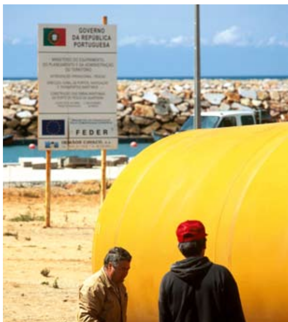
Quarteira (Portugal) sadama kaasajastamine

Muidugi võib heita ette, et komisjoni pädevad talitused oleksid enamiku ette nähtud meetmeid igal juhul võtnud. Kui Euroopa integreeritud merepoliitika eesmärk on just nende kooskõlastamine, et järgida mõistliku arengu üldeesmärki. Seda huvi väljendatigi rohelise raamatu konsulteerimisprotsessis ja seetõttu peakski loodama kalanduse peadirektoraadi merendusküsimuste struktuuriüksus ja selle võimu peaks lähemas tulevikus tugevdama.