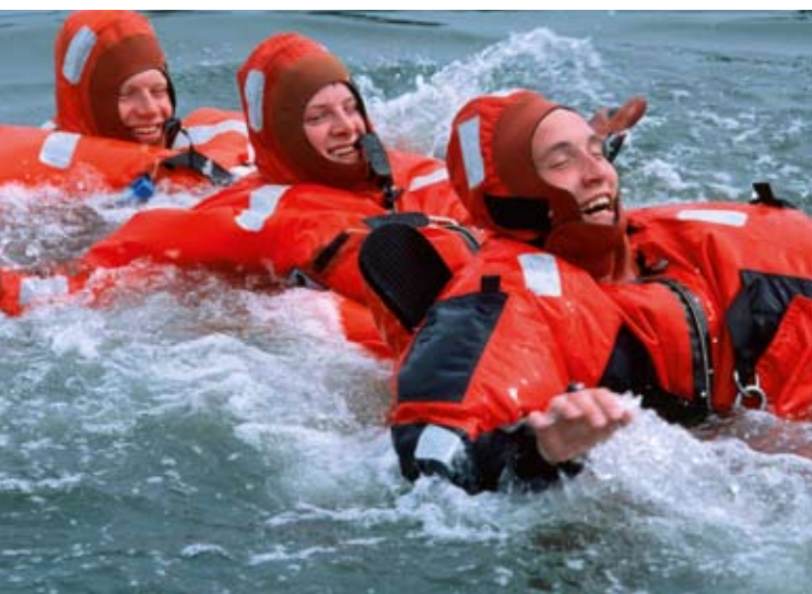
Koolitus mereohutuse alal

Tegevuskava , mis peaks vastu võetama 2007. aasta detsembrikuisel nõukogu koosolekul, on tõeline Euroopa uue merenduspoliitika „piibel”. Selles on ette nähtud umbes kolmkümmend tegevust, mis on rühmitatud viie suure eesmärgi järgi: