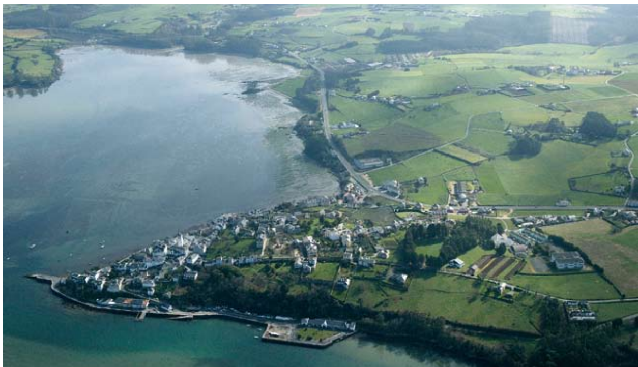
Castropol, Astuuria läänepoolne ots

Võideldes oma majanduse peamiste sektorite – põllumajandus, kalandus, metallurgia – ümberkorralduse eest, püüab Astuuria kasutada oma ranniku looduslikke, kultuurilisi ja inimressursidealaseid trumpe, et tagada oma (taas)areng. See ongi piirkondliku merendusstrateegia kogu mõte.