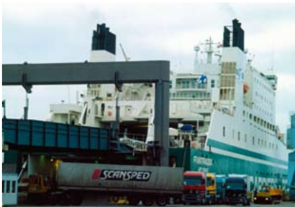
Praam Kieli (Saksamaa) sadamas

Sellepärast peavad klasterite arendamisega kaasneva investeeringud merendusala arendusse ja koolitusse. Kvalifitseeritud merendustöötajate võimalikul nappusel võib nimelt olla ärevakstegevaid tagajärgi, eelkõige merendusohutuse infrastruktuuridele. Ajapikku tekib ka oht, et mõned klasterid nõrgenevad või moodustuvad uuesti piirkondades, kus on kvalifitseeritud tööjõud.