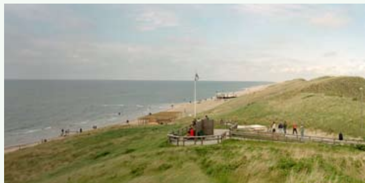
■ Luited pakuvad ühteaegu kaitset ja vaadet