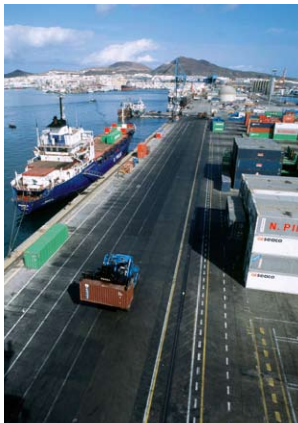
Las Palmase (Kanaarid, Hispaania) konteinersadama arendamine

http://ec.europa.eu/regional_policy/cooperation/interregional/ecochange/index_en.cfm