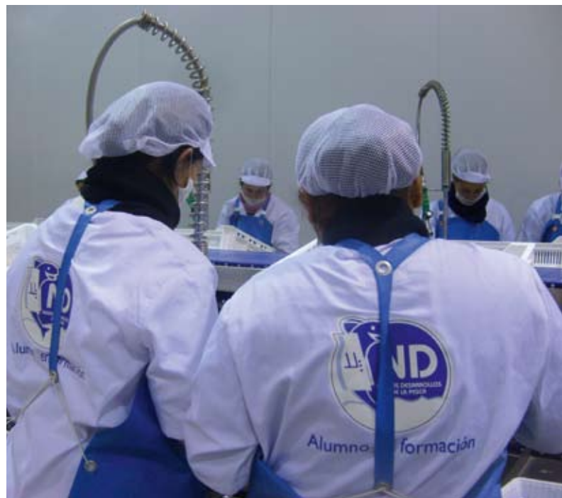
Uute töötajate koolitus Cudillero's