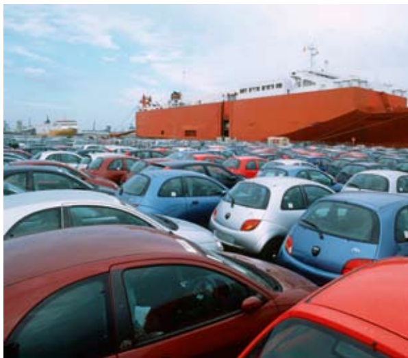
Autoterminal Valencia (Hispaania) sadamas

Lõpuks võivad klasterid arvestada Euroopa ühtekuuluvuspoliitika olulise toetusega. Nimelt on ajavahemikul 2007–2013 tehtud investeeringute seas kõikides piirkondades ja liikmesriikides prioriteetne sektor uuendus: uuendusse investeerimine võimaldab tagada jätkusuutliku majanduskasvu ja selle eesmärgi saavutamiseks on klastrite arendamine üks vahend, mis piirkondade käsutuses on. Ühenduse ühtekuuluvuspoliitika strateegilistes suunistes (1) , mis Euroopa Ülemkogu võttis vastu 2006. aasta oktoobris, on täpsustatud, et tänu uurimis- ja arendustegevuse valdkonnas tehtud investeeringutele peab eelkõige olema võimalik „ettevõtete vahelise ning ettevõtete ja riiklike teadus-/ kõrgharidusasutuste vahelise koostöö suurendamine, toetades näiteks piirkondlike ja piirkondadevaheliste tippkeskuste klastrite loomist”. See käib mõistagi rannikupiirkondade ja klastrite kohta, mida need merendussektoris arendavad. Algatus „Piirkonnad majandusmuutustes” (vt kasti)