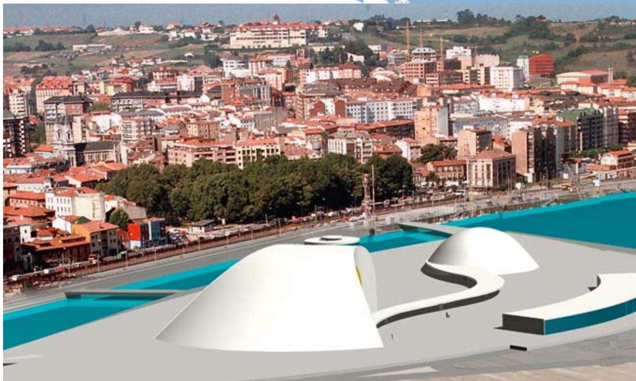
Tulevane Oscar Niemeyeri keskus kujundab Avilés'i linna ümber

puhul välja töötasime, on eksporditud peaaegu igale poole maailma..."