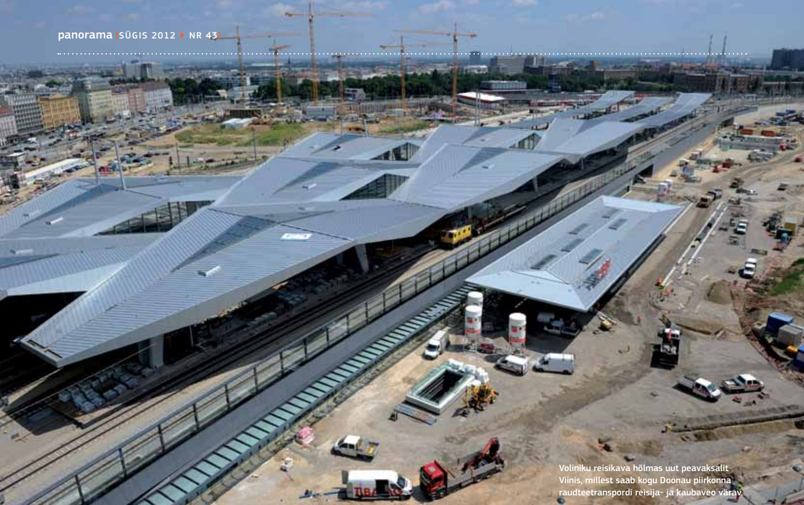
Voliniku reisikava hõlmas uut peavaksalit Viinis, millest saab kogu Doonau piirkonna raudteetranspordi reisija- ja kaubaveo värav.