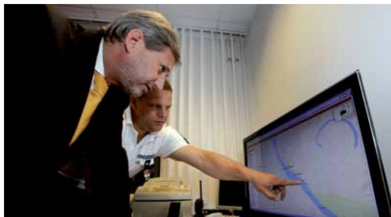
Integreeritud Schengeni piiripunkt jõel Ungari ja Horvaatia vahel Mohácsi sadamas oli samuti üks volinik Hahni külastatud kohtadest, kus ühe katuse all on olemas kõik uusim infotehnoloogial põhinevad teenused ja mis edendab liikuvust ja kaubandust ning parendab samas turvalisust.