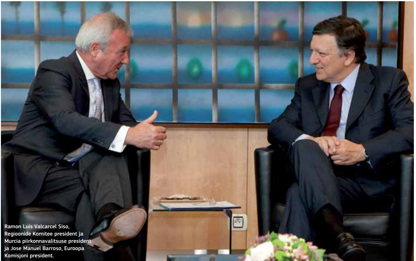
Ramon Luis Valcarcel Siso, Regioonide Komitee president ja Murcia piirkonna valitsuse president ja Jose Manuel Barroso, Euroopa Komisjoni president.