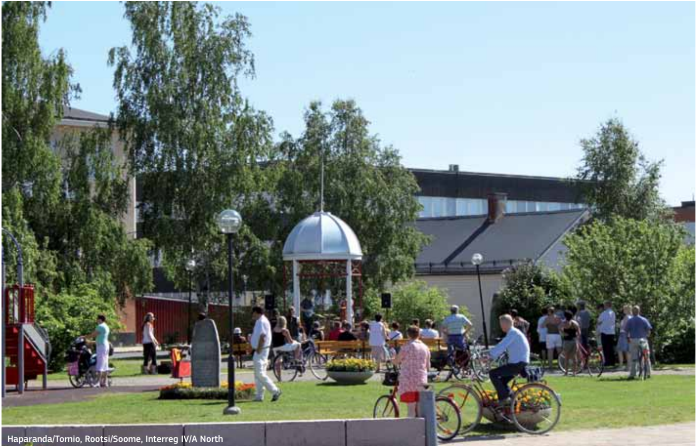
Haparanda/Tornio, Rootsi/Soome, Interreg IV/A North

koostööprogrammidele temaatiliste eesmärkide valimisel rohkem paindlikkust: 80% programmi rahalistest vahenditest peaks keskenduma neljale temaatilisele eesmärgile, nii nagu komisjon välja pakkus, aga ülejäänud 20% võiks kasutada mis tahes muuks loendisse kuuluvaks eesmärgiks. Konkreetsed läbirääkimised liikmesriikidega ETK määruse sätete üle algasid Küprose ELi eesistumisperioodil.