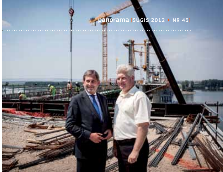
Vidin-Calafati sild Bulgaaria ja Rumeenia vahel, mis peaks valmima 2012. aasta lõpuks, ja osa üleeuroopalisest transpordivõrgustikust, mis parendab ühendusi Bulgaaria loodeosaga, Rumeenia edelaosaga ja Ungari idaosaga.

2012. aasta novembris korraldab komisjon koos Baieri ametkondadega esimese strateegia aastafoorumi, mis annab täiendava võimaluse tehtud töö hindamiseks, strateegia loodud väärtuse näitamiseks, avalikkuse teadlikkuse tõstmiseks ja paremate tulevikuplaanide kavandamiseks. Ootame huviga kõigi sidusrühmade ettepanekuid ja ideid.