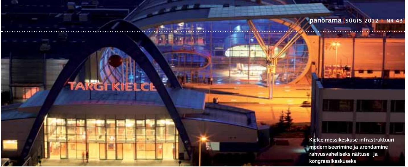
Kielce messikeskuse infrastruktuuri moderniseerimine ja arendamine rahvusvaheliseks näituse- ja kongressikeskuseks

energiajulgeoleku ja keskkonnaga. ELi fondide perioodil 2014–2020 kasutamise aruteludel ei lähtuta üksnes probleemidest, vaid ka võimalusest nende kõrvaldamiseks ning sekkumiste kõige tõhusamast ulatusest ja vormist. Õigete vastuste leidmiseks korraldab regionaalarengu ministereerium ekspertide arutelusid tulevase ühtekuuluvuspoliitika erinevate temaatiliste eesmärkide üle, kohtumisi selliste võtmeosalajatega nagu ministereeriumide, linnade, piirkondade ja ettevõtete esindajad, sotsiaal- ja majanduspartnerid, sh riikliku territoriaalfoorumi istungeid.