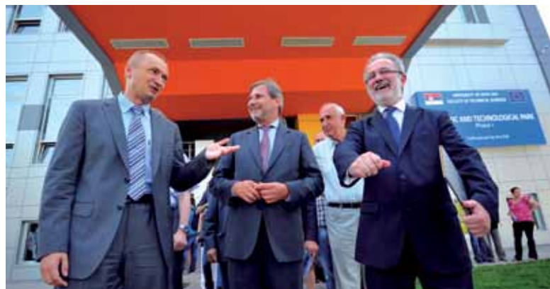
Volinik Hahn külastas ettevõtlusinkubaatori ja teaduspargi projekte Osijekis (Horvaatias) (pildil) ja Novi Sadis (Serbias), mis loovad sidemeid uurimistöö, uuenduse ja ettevõtluse vahel.