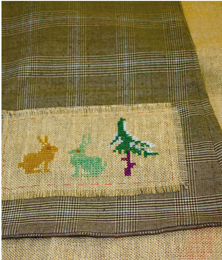
Esimesi ristpisteharjutusi saab kasutada kas kaartide või kotikeste kaunistamiseks.

Mida tikkida? “Siin tahaks küll öelda, et kõike, mida kauniks peate. Ise aastakümneid tarkade kunstiinimeste jutte arvestanuna ja volehäbi all kannatanuna tahan kõigile rõhutada, et ilus on see, mis just inimesele endale meeldib, ja mitte kellelgi ei ole õigust tema maitset maha teha. Kui kellelegi meeldivad kasside ja koertega padjad, siis on need tema jaoks ilusad ja ta teeb need oma kodu jaoks, kus temal peab olema hea olla,” julgustab raamatu autor.