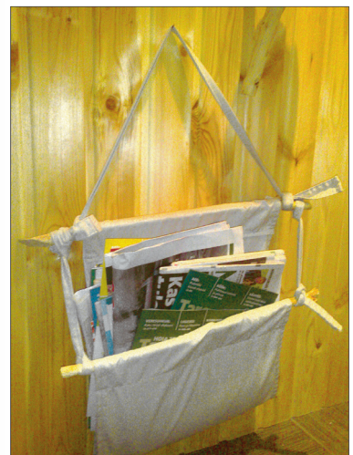
Servades olevatesse kanalitesse pandud pulgad hoiavad hoidiku vormis, paelad on selle kooshoidmiseks ning seinale kinnitamiseks.