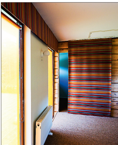
► Teise korruse triibuline lükanduks ja karniis. Viimase taga on peidus ka palkidele jäetud vajumisvaru.