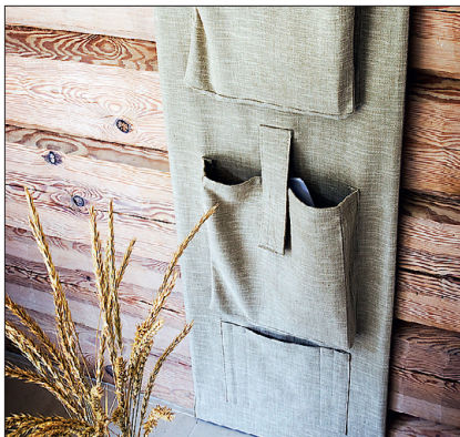
► Panipaigale lisaks varjab tekstiilitasku ka tülikaid juhtmeid seinal.