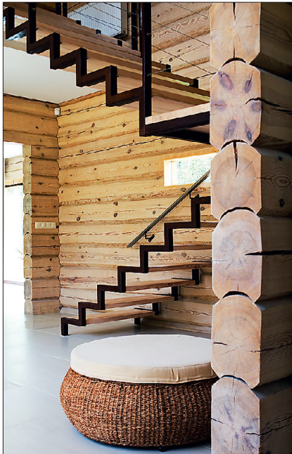
► Ka teisele korrusele viiva trepi metallosa on saanud roostekarva välimuse.