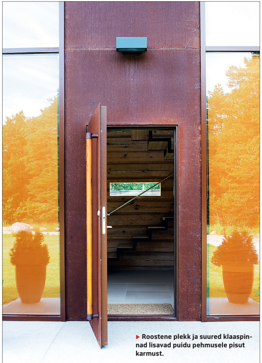
► Roostene plekk ja suured klaaspinnad lisavad puidu pehmusele pisut karmust.

masolu. Seda ilmselt seepärast, et puudub raam klaasi ja palgi vahel.