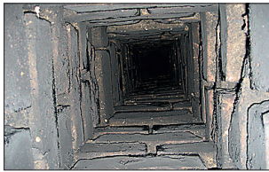
► Vana suitsulõõr kaetakse tulekindla seguga...

Puuküttega maja puhul (pliidid, ahjud, kaminad, saunakerised jms) kasutatakse korstna renoveerimi-