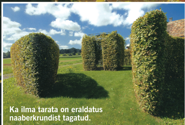
Ka ilma tarata on eraldatus naaberkrundist tagatud.