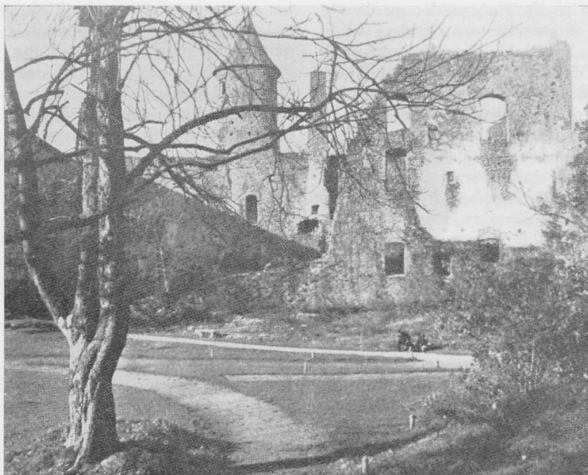
Slottsruinen i Hapsal

Hur fattiga, hur karga dessa stränder, där svenska bönder sedan sekler stred om torvan, vilken årderplojen vänder, om havet, där de sänka näten ned!