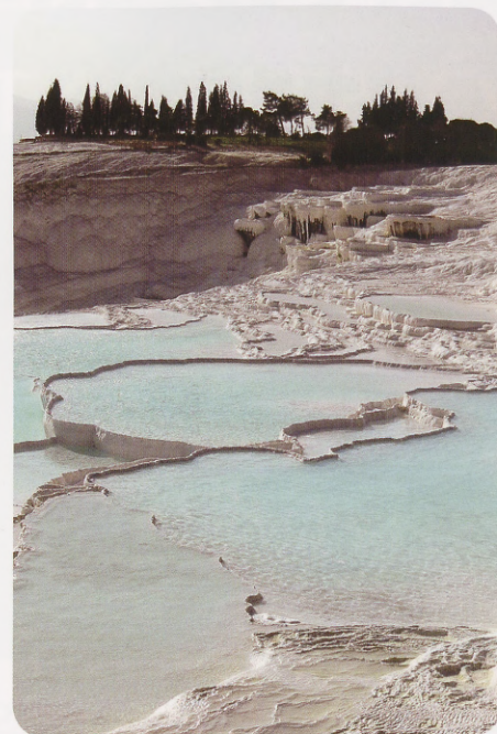
Gorgeous landscapes of Turkey.

and publications. Each university consists of faculties and four-year schools, offering bachelor's level programs, the latter with a vocational emphasis, and two-year vocational schools offering pre-bachelor's (associate's) level programs of a strictly vocational nature. Graduate-level programs consist of master and doctoral programs, coordinated by institutes for graduate studies. Master's programs are specified as "with thesis" or "without thesis" programs. "With thesis" master's programs consist of a specified course completion followed by a submission of a thesis whereas "without thesis" programs consist of completion of graduate courses and a term project. The duration of these programs is two years at least. Access to doctoral programs requires a master's degree. Doctoral programs have a minimum duration of four years which consists of completion of courses, passing doctoral qualifying examination, and preparing and defending a doctoral thesis. Medical specialty training programs equivalent to