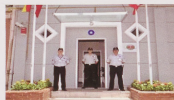
Offices in Turkey

KB Gold omab kogu protsessi kaevandamisest kuni turustamiseni.