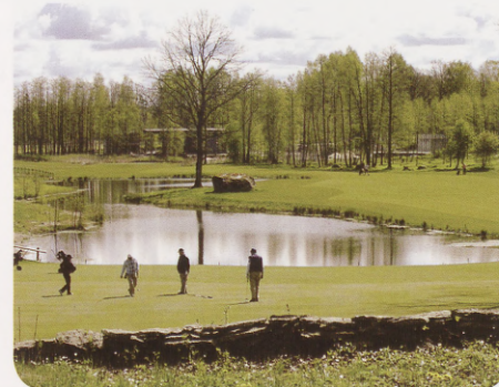
Golf on atraktiivne erinevatele vanusegruppidele.

Teeing ground – tii. Ala, millelt sooritatakse rajal esimene löök. Tavaliselt kasutatakse kolme tiid,