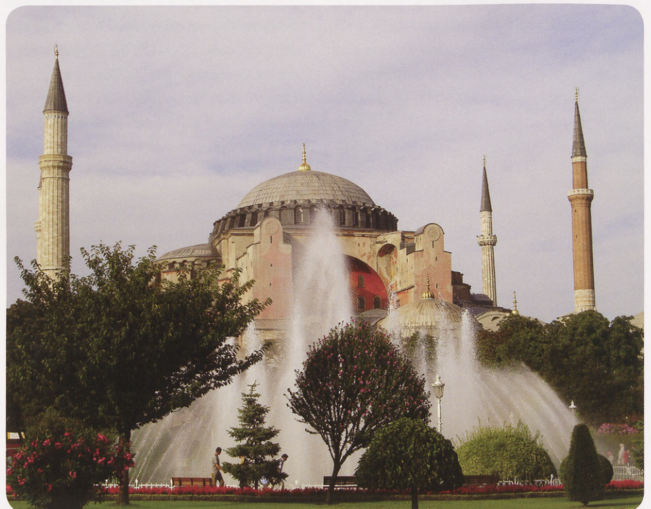
Islamic Heritage of Turkey.

In Turkey, one can find affordable education. Tuition and the cost of living is lower than in most European countries and the US. As a young nation (31% of the Turkish population are between the ages of 12 - 24 ), Turkey welcomes young people and students from all over the world and all Estonians who want to make their studies in Turkey are welcome. The traditional hospitality of Turkish people is also to be mentioned here.