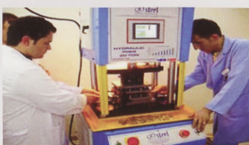
Production of small bullion gold bars