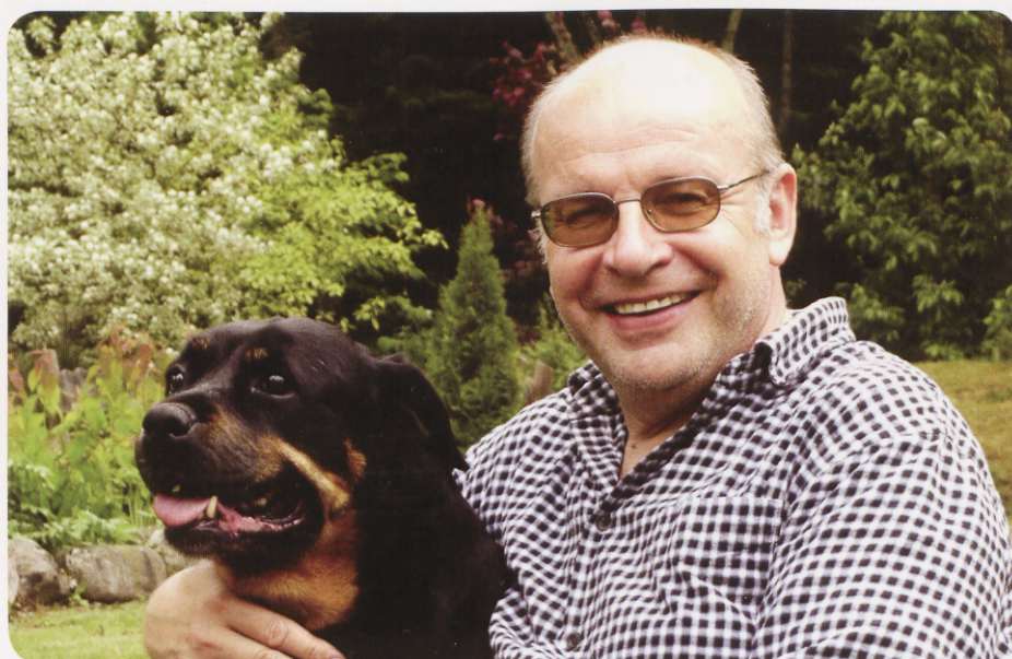
Koduaias viis aastat tagasi koos lemmiku Bessiga.

Esmalt, nagu igas ettevõtmises, on tarvis teha eelnev põhjalik uurimustöö, analüüsida riigis juba tehtut ja saadud kogemust selles valdkonnas ning seostada ja