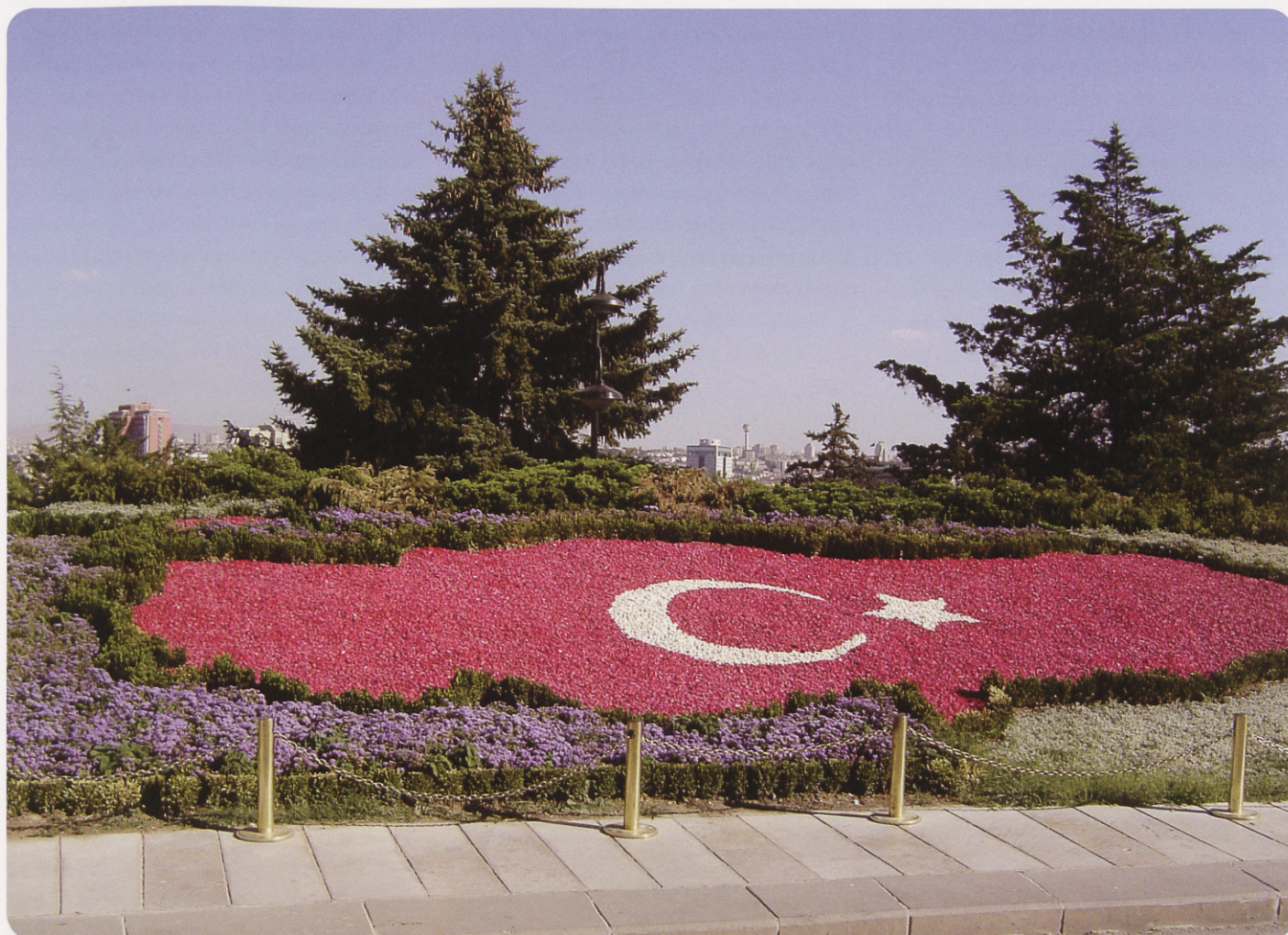
Turkey is a transcontinental Eurasian country.

International students must obtain a valid student visa from the Turkish Embassy in their country. A student visa is required for registration and must be obtained before entering Turkey. International students should apply with the official letter from their university or with the letter of acceptance from the university concerned. All international students, regardless of status, must register with, and obtain a Residence Permit (Ikamet Belgesi) from the Department of Foreign Section at the Directorate of Security.