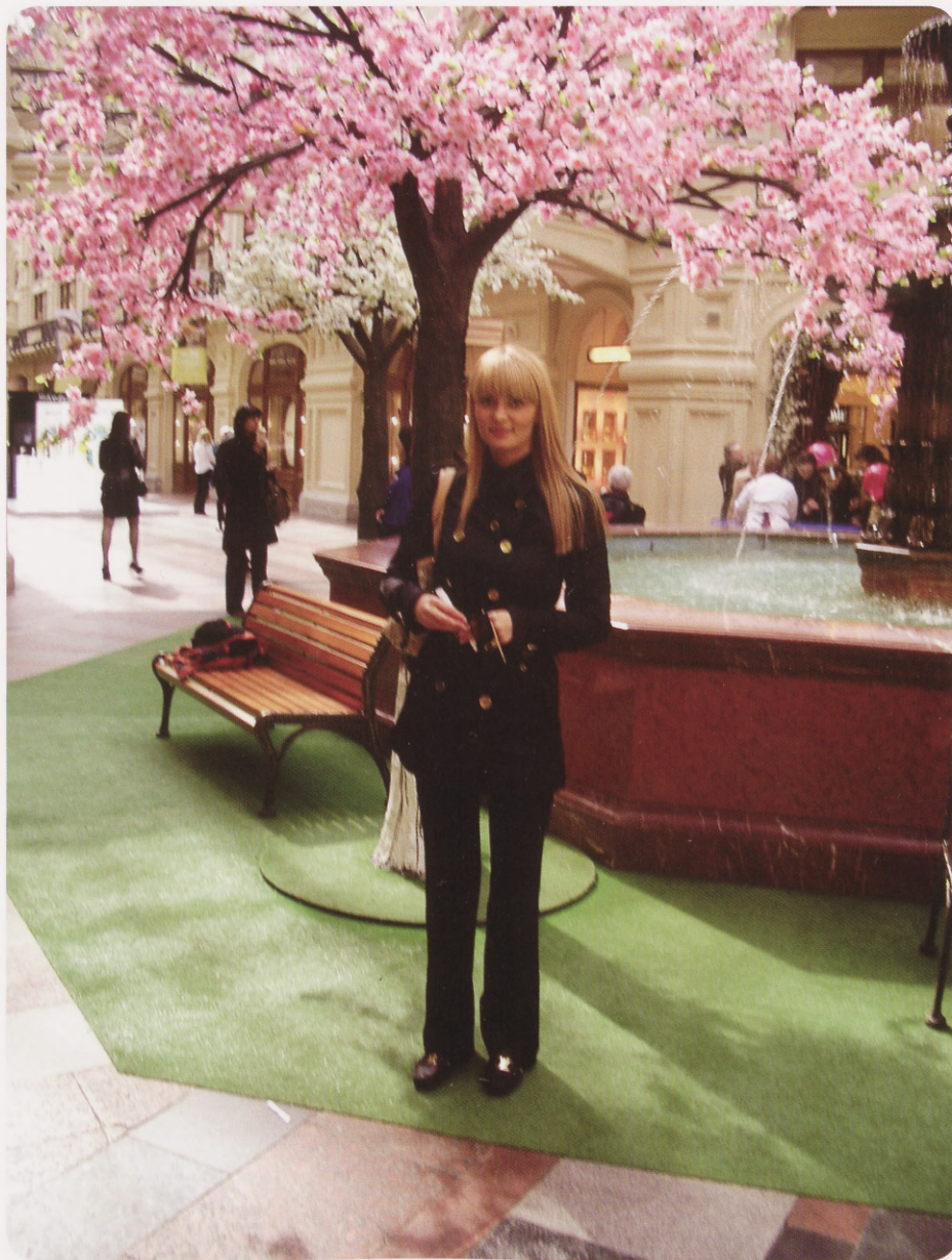
Esimene kevad Moskvast.

olemisest ammutan tuge ja täisväärtuslikuks eluks hädavajalikkude hingelist stabiilsust.