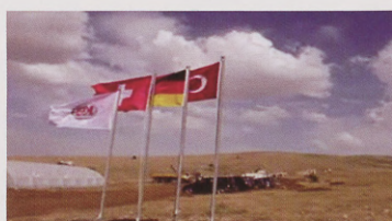
Gold-mine in Turkey