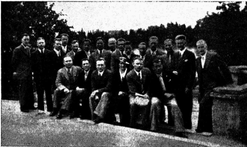
Eesti ja Soome jalgpallimehed Tartu Raadi pargis.

Üldse oli võistlustest osa võtnud 19 sportlast.